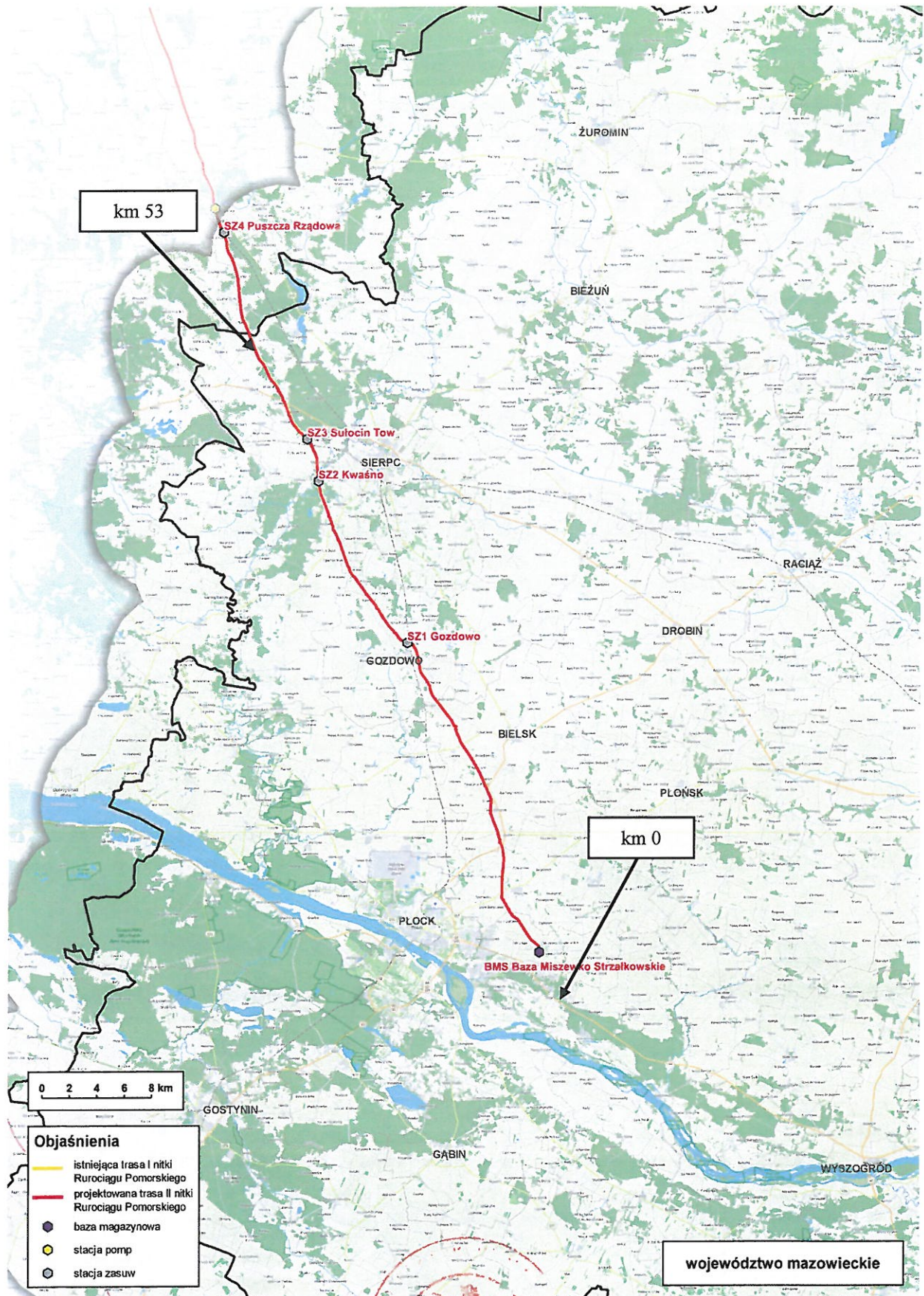
Rys. 3 Trasa planowanej II nitki RP w województwie mazowieckim