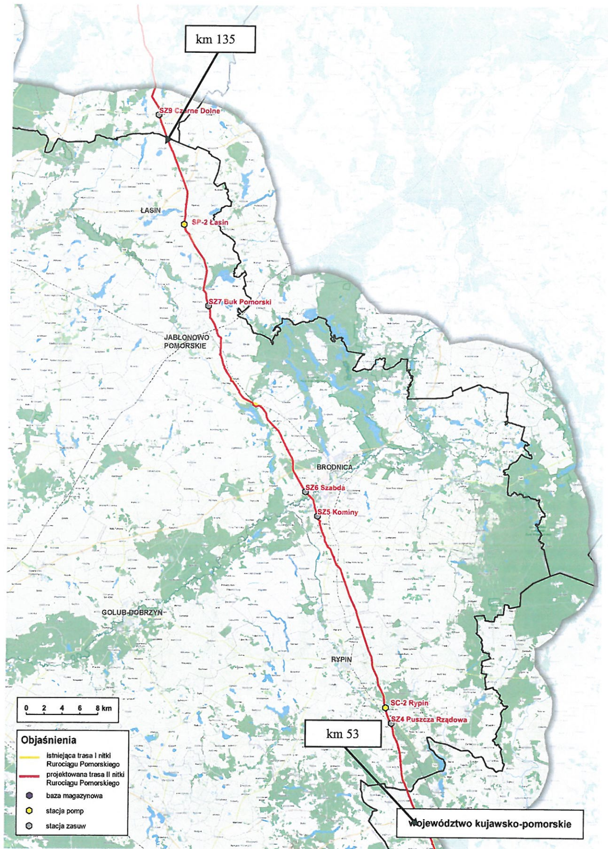
Rys. 2 Trasa planowanej II nitki RP w województwie kujawsko-pomorskim