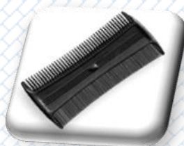
gęsty grzebień wyczesujący wszy i gnidy