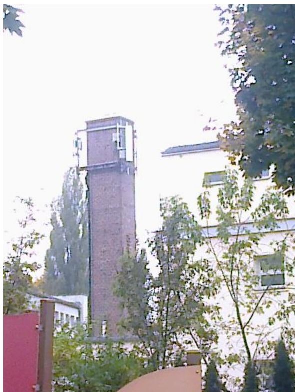
Fot. 1: Widok anten stacji bazowej ID: POZ0006, zlokalizowanej pod adresem: ul. Kazimierza Wielkiego 17, 61-863 Poznań