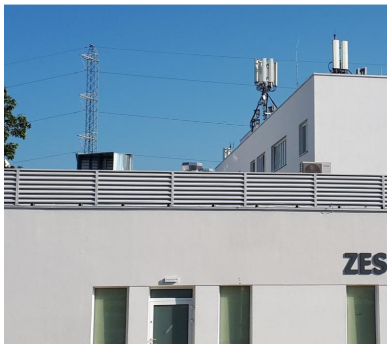
Fot. 1: Widok anten stacji bazowych: ID: ZGO1017, ID: 41382 (61382N!), zlokalizowanych pod adresem: ul. Wiejska 2, 65-729 Zielona Góra