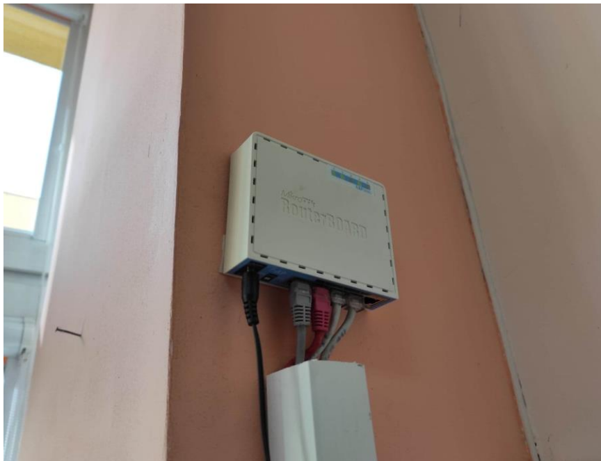
Fot. 1: Punkt dostępowy model hAP lite