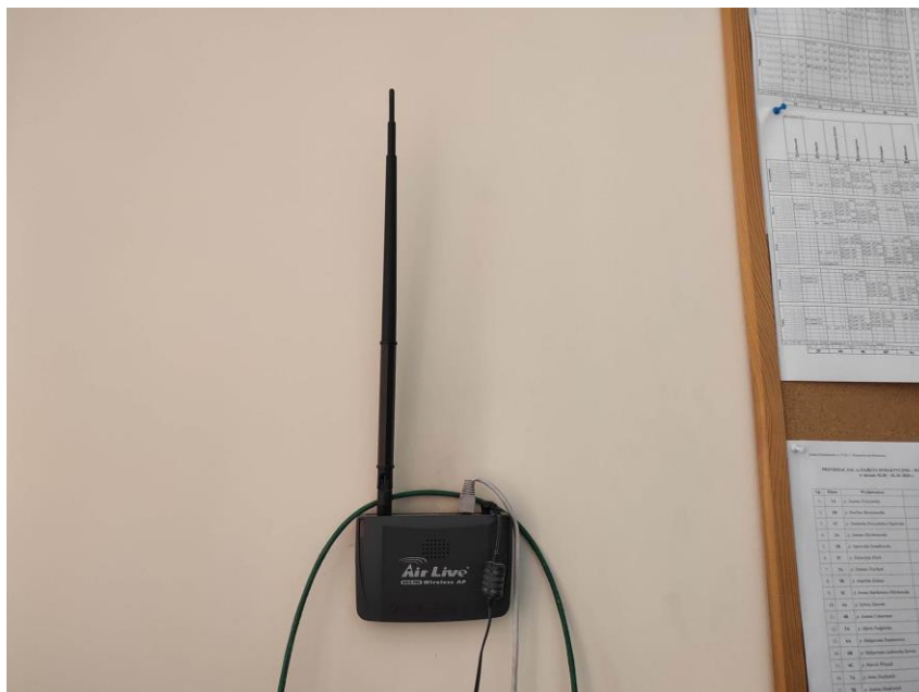
Fot. 2: Punkt dostępowy model WL-5460AP