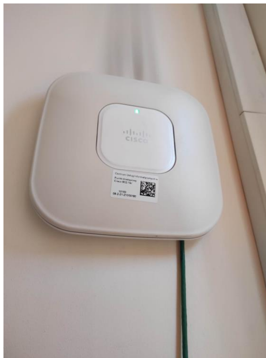
Fot. 3: Punkt dostępowy model AIR-LAP1142N-E-K9