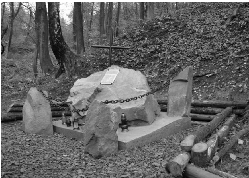
Upamiętnione miejsce śmierci Andrzeja Łada-Bieńkowskiego w lesie nieopodal więzienia w Wiśniczu. Źródło: https://www.czasbochenski.pl/portal/bochnia-wydarzenia/nowy-wisnicz-80-rocznica-meczenskiej-smierci-10-wiezniow/18093/ .