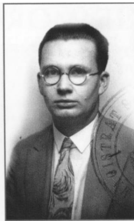
Prokurator Andrzej Łada-Bieńkowski