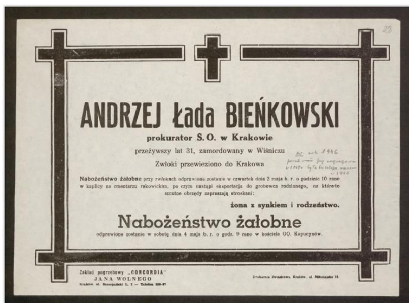
Nekrolog Andrzeja Łada-Bieńkowskiego.