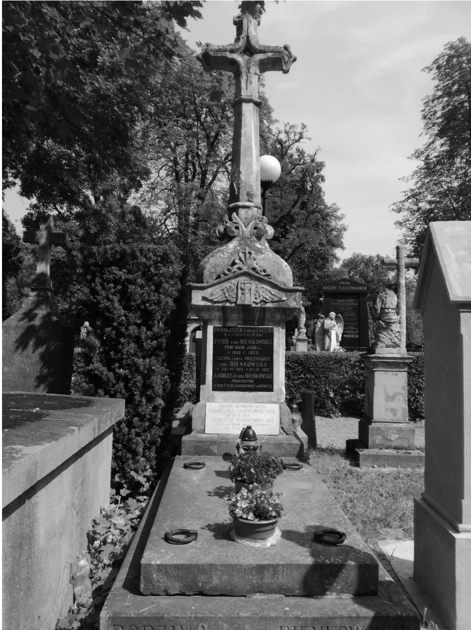
Grobowiec rodziny Bieńkowskich na Cmentarzu Rakowickim w Krakowie – miejsce pochówku Andrzeja Łada-Bieńkowskiego.