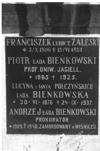
Tablica na grobie na Cmentarzu Rakowickim w Krakowie.