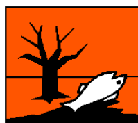
Niebezpieczny dla środowiska