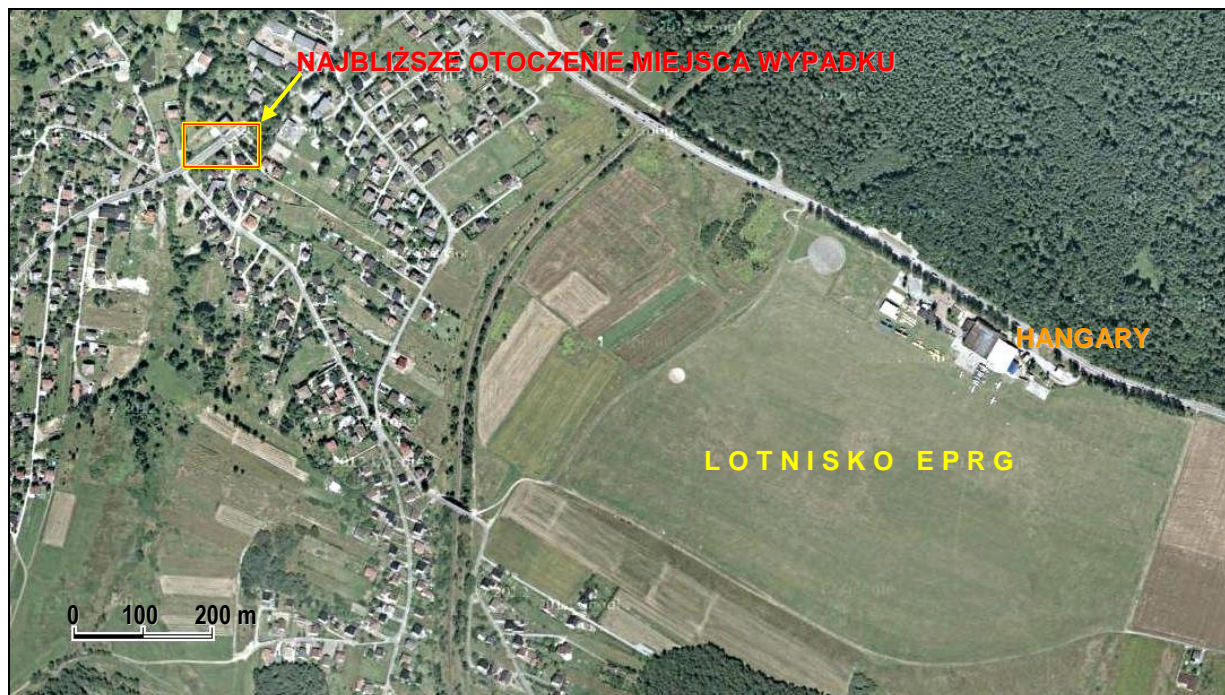
1 – Okolice lotniska Rybnik-Gotartowice [EPRG] z zaznaczoną strefą najbliższego otoczenia miejsca wypadku, pokazaną szczegółowo na następnej ilustracji.