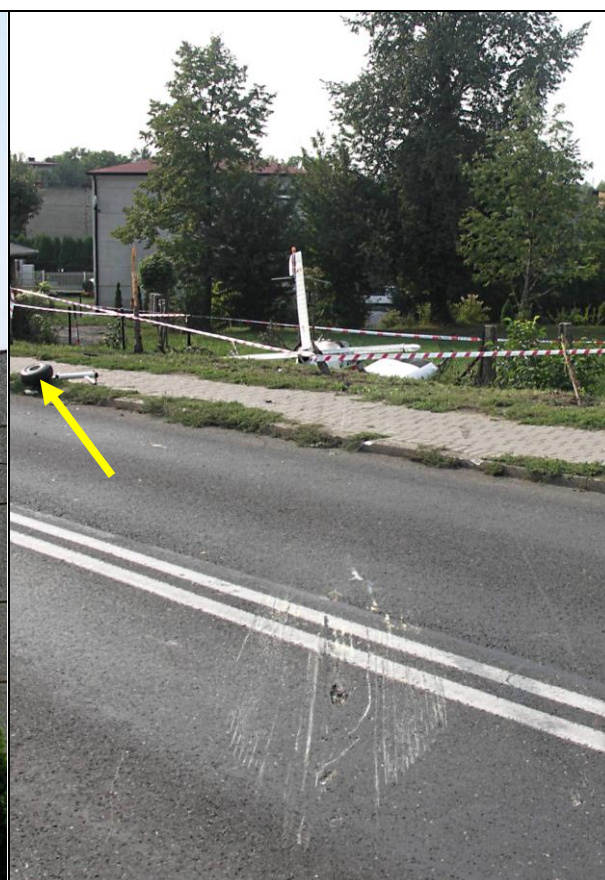
5 – Ślady zderzenia samolotu z nawierzchnią ulicy. Na dalszym planie odtamane lewe podwozie główne [strzałka]. W głębi wrak samolotu.