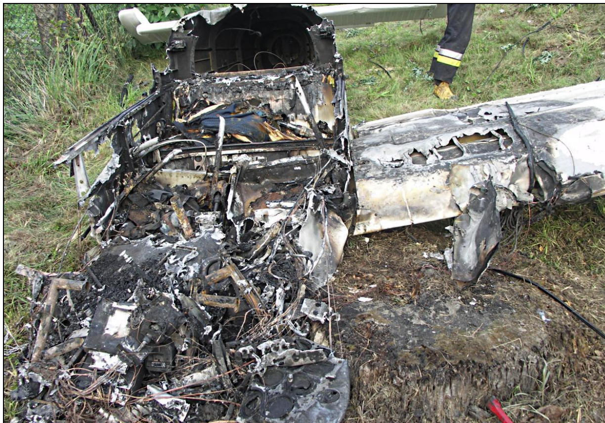
23 – Zniszczona pożarem przednia część kadłuba i przykadłubowy fragment lewego skrzydła, widok od przodu.