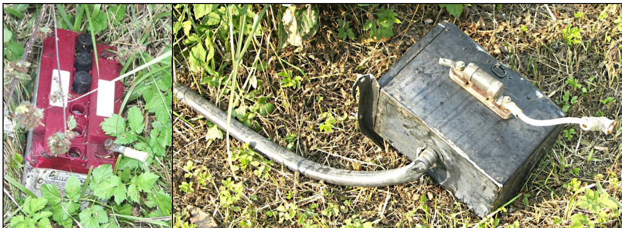
28, 29 – Akumulator i skrzynka akumulatora.