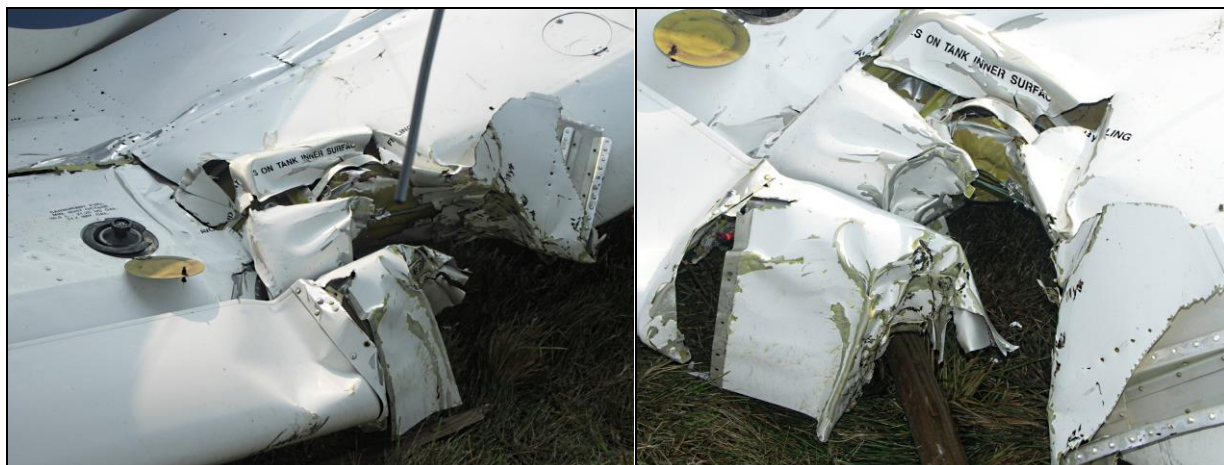
14, 15 – Prawe skrzydło w miejscu kontaktu ze słupkiem ogrodzenia.