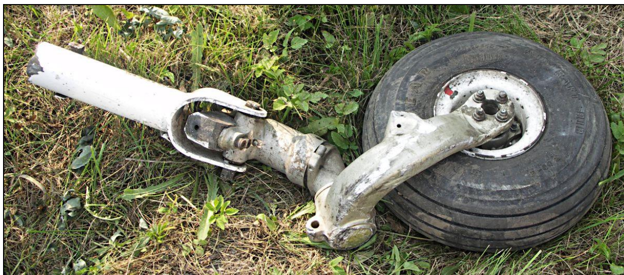
19 – Wylamane podwozie przednie.