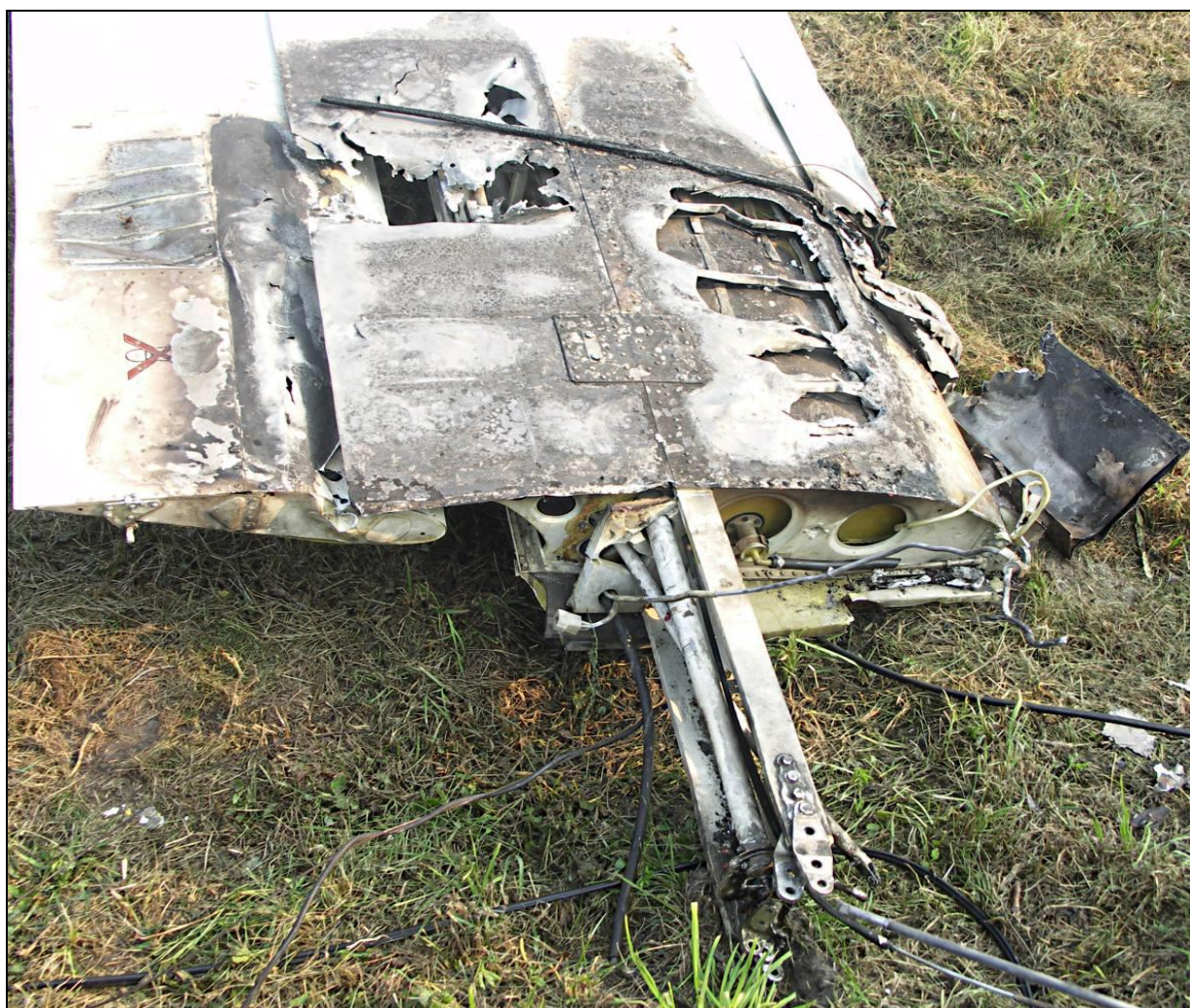
20 – Przykadłubowy fragment zdemontowanego lewego skrzydła ze zniszczeniami spowodowanymi pożarem.