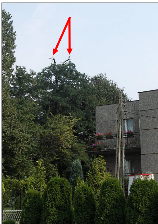
4 – Korona drzewa uszkodzona przez samolot. Widok w kierunku w przybliżeniu przeciwnym do kierunku lotu.