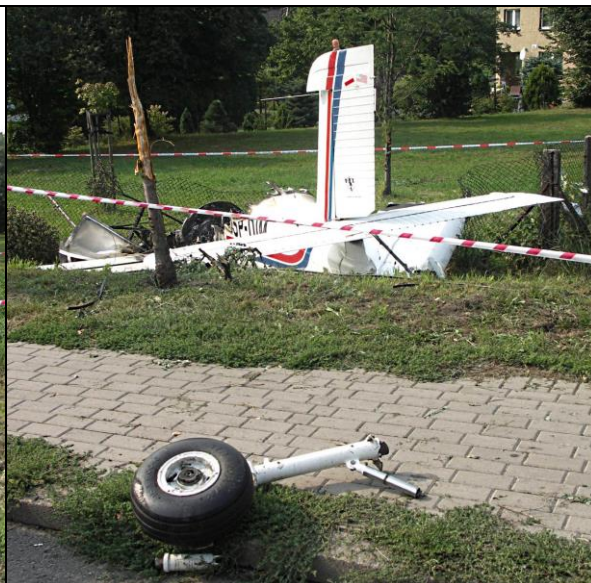
7- Wrak samolotu na miejscu wypadku. Na pierwszym planie widoczne odłamane lewe podwozie główne, dalej drzewo zniszczone przez samolot.