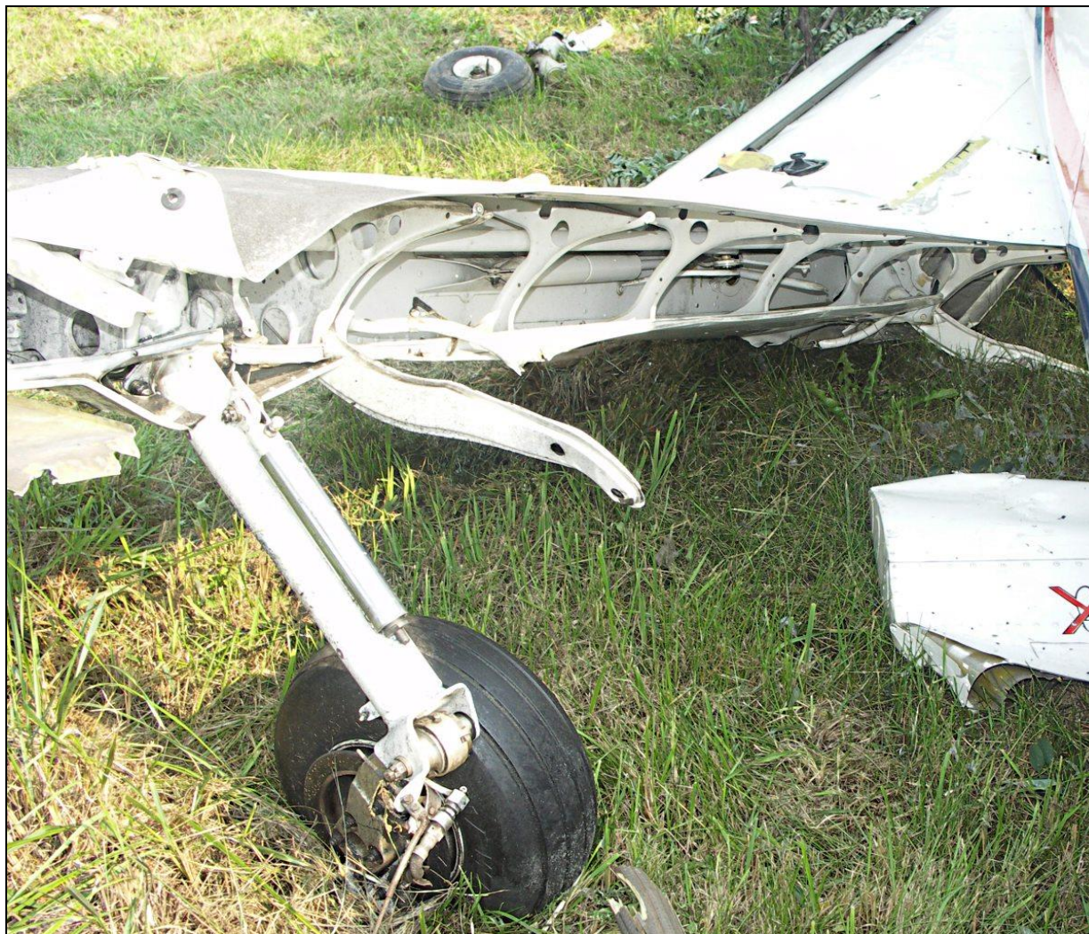
17 – Prawe skrzydło od strony spływu. Widoczne złamane prawe podwozie główne i fragment prawej klapy.