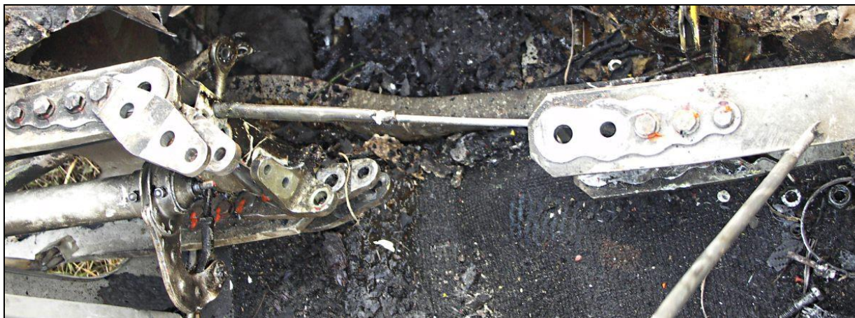
21 – Połączenie głównych dźwigarów skrzydeł w kadłubie, sfotografowane w trakcie demontażu.