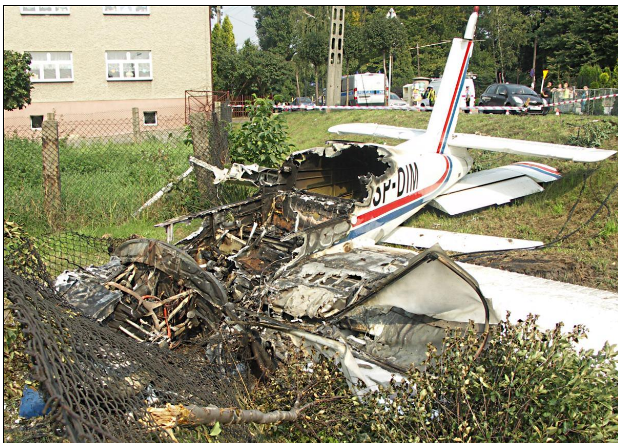
12 – Wrak samolotu, widok ¾ od przodu z lewej. Widoczna strefa wypalenia kadłuba, zespołu napędowego i lewego skrzydła.