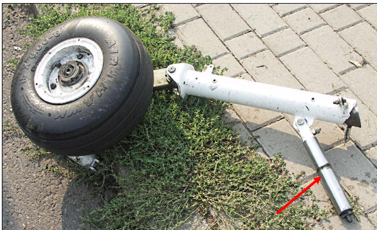
18 – Wylamane lewe podwozie główne z tłoczyskiem amortyzatora [strzałka].