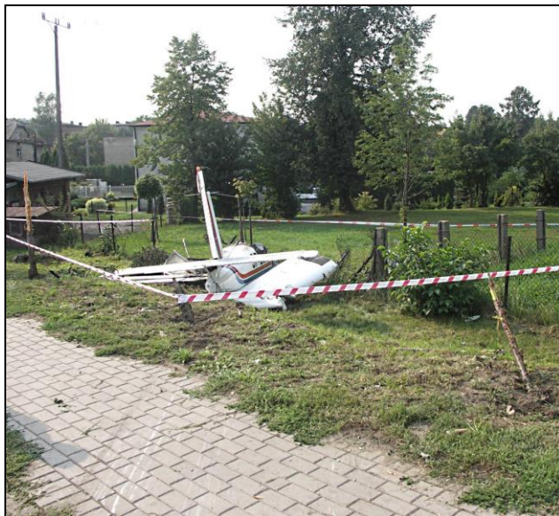
6 – Wrak samolotu po zatrzymaniu się za ulicą.