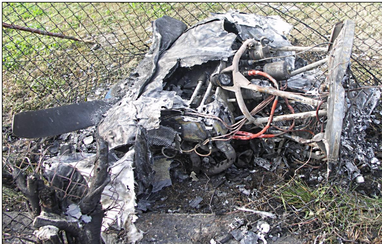
25 – Zespół napędowy po odcięciu od wraku, widok z lewej strony.