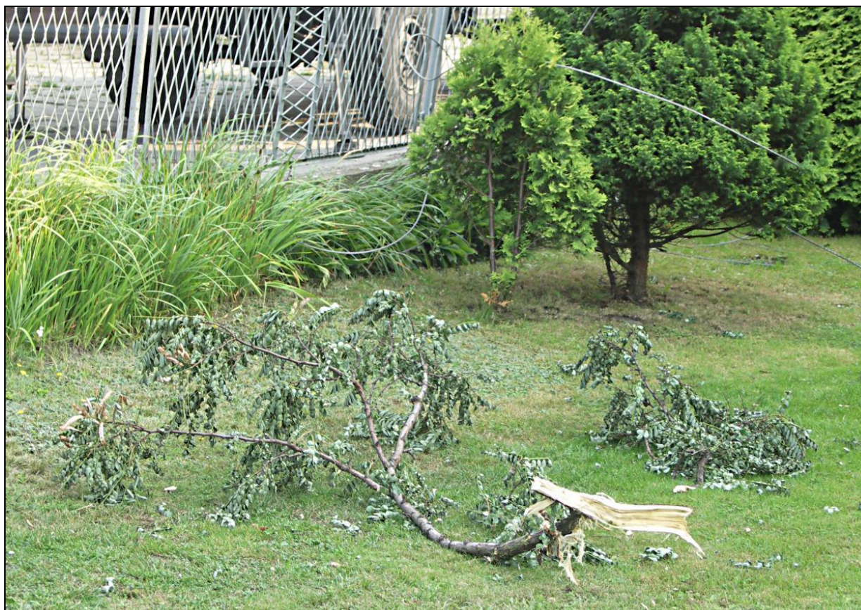
3 – Gałęzie wylamane z korony drzewa przez zniżający się samolot.