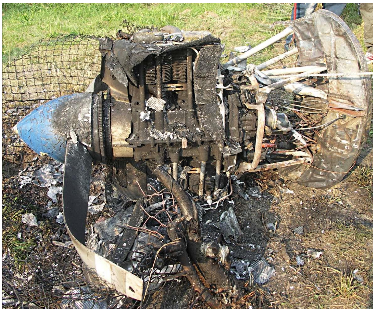
26 – Zespół napędowy po odcięciu od wraku, widok z góry.