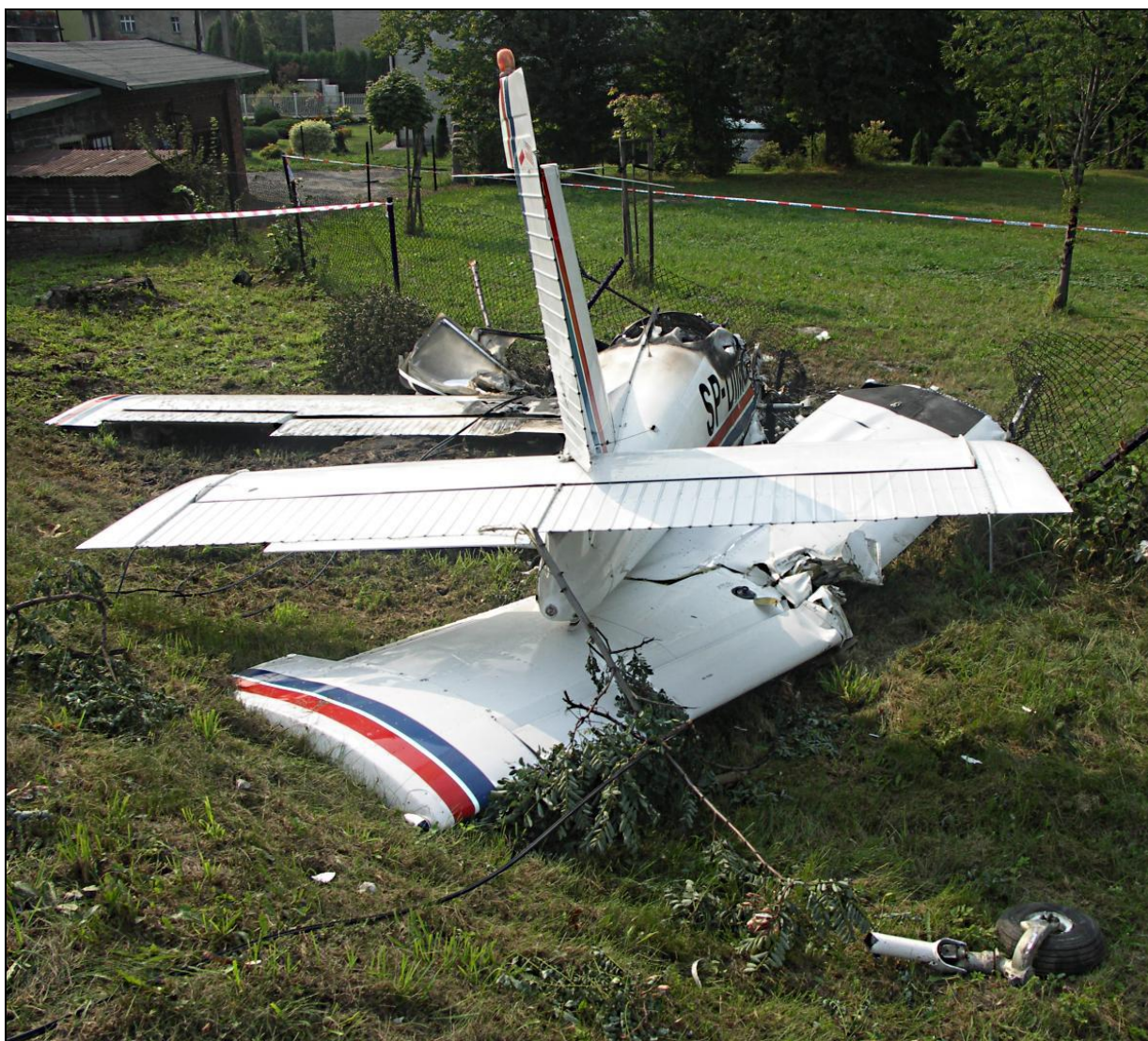
8 – Wrak samolotu, widok od tyłu. Na pierwszym planie wylamane podwozie przednie. Pod kadłubem widoczne wyrwane z okuć i złamane prawe skrzydło z wyraźnym śladem zderzenia ze słupkiem ogrodzenia.