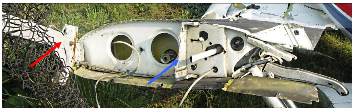
16 – Prawe skrzydło od strony żebra nasadowego. Widać wyrwany fragment wręgi kadłuba [czerwona strzałka] i złamany dźwigar główny [niebieska strzałka].