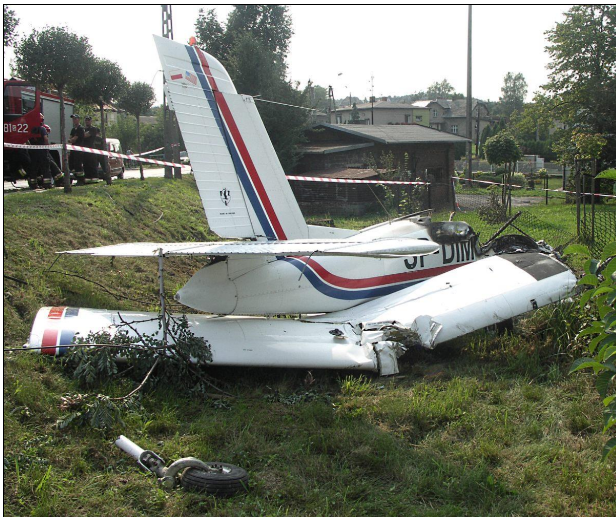
9 – Wrak samolotu, widok \frac{3}{4} od tyłu z prawej. Na pierwszym planie wylamane podwozie przednie. Pod kadłubem widoczne wyrwane z okuć i złamane prawe skrzydło z wyraźnym śladem zderzenia ze słupkiem ogrodzenia.