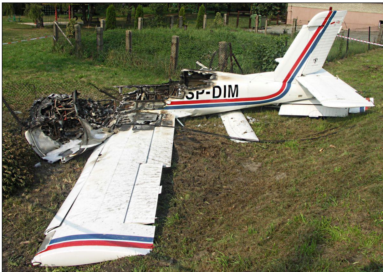
13 – Wrak samolotu, lewa strona. Widoczna strefa wypalenia kadłuba, zespołu napędowego i lewego skrzydła. Spod kadłuba wystaje oderwana kłapa prawego skrzydła.