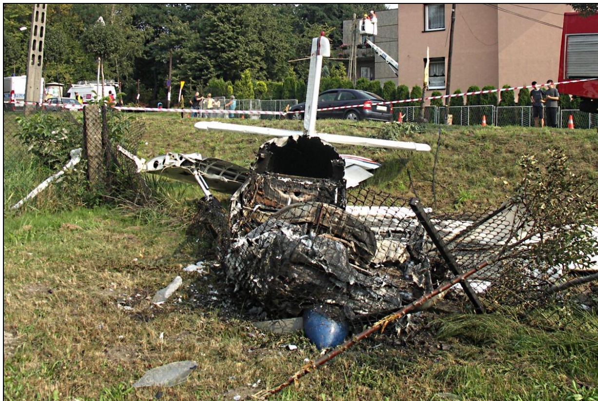
11 – Wrak samolotu, widok od przodu.