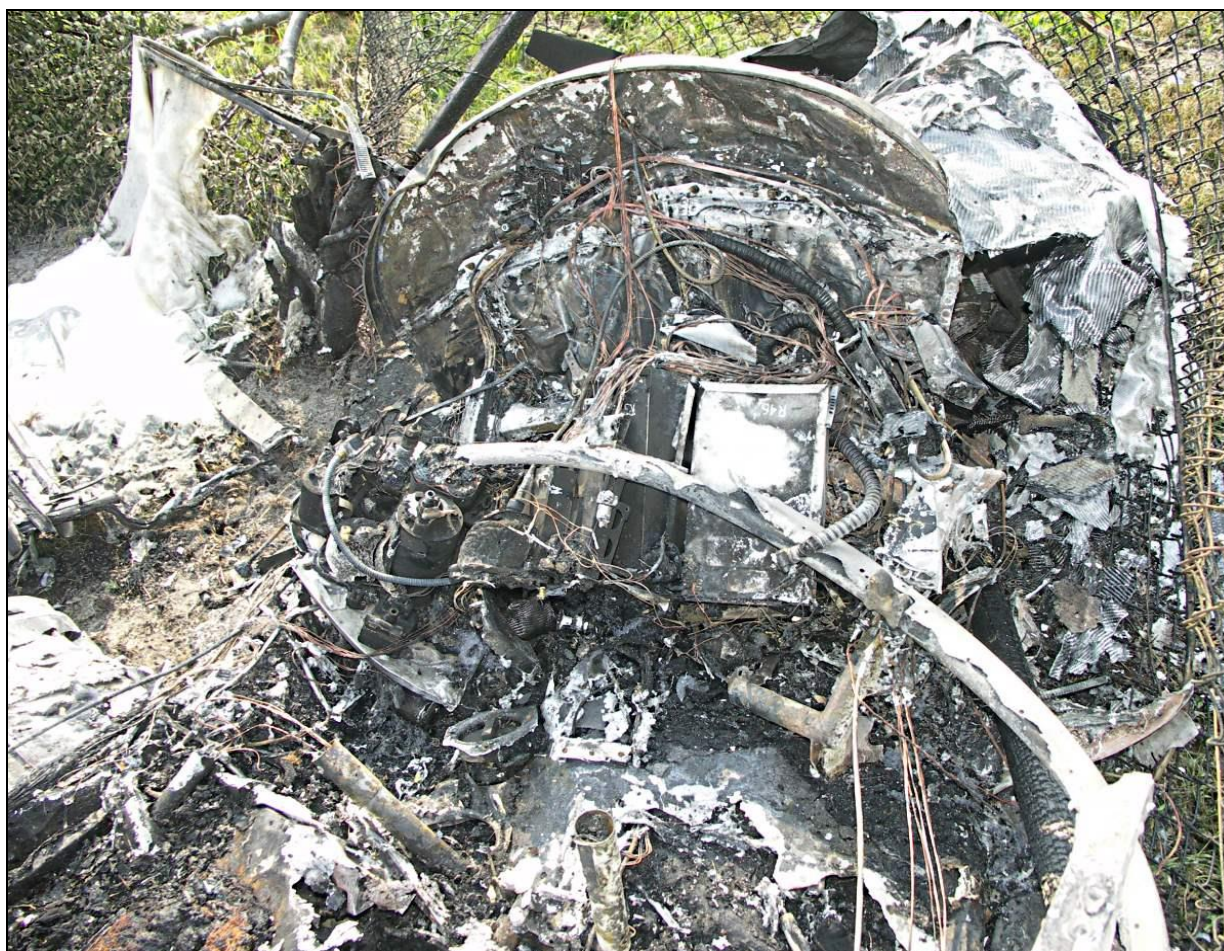
24 – Wypalona kabina załogi, widok od tyłu.