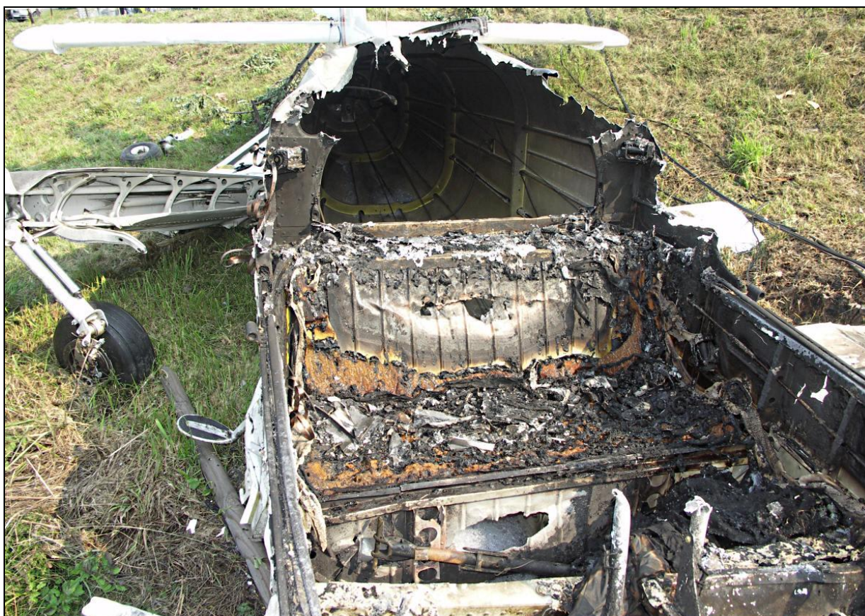
22 – Wypalone wnętrze kabiny i fragment tylnej części kadłuba.