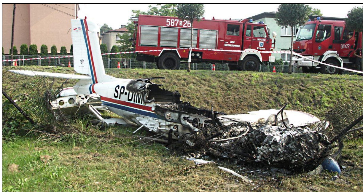
10 – Wrak samolotu, widok \frac{3}{4} od przodu z prawej. Widoczna strefa wypalenia kadłuba i zespołu napędowego.