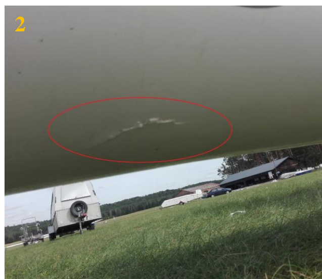
Rys. 2 Uszkodzenia szybowca SZD-51-1 Junior