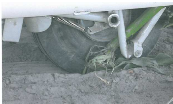
Rys.3 Widok na podwozie z prawej strony.