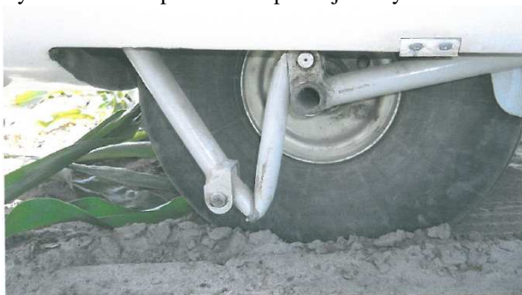
Rys. 5 Zbliżenie na podwozie z lewej strony.