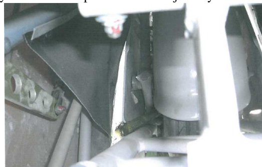
Rys.6 Widok na podwozie wewnątrz kadłuba.