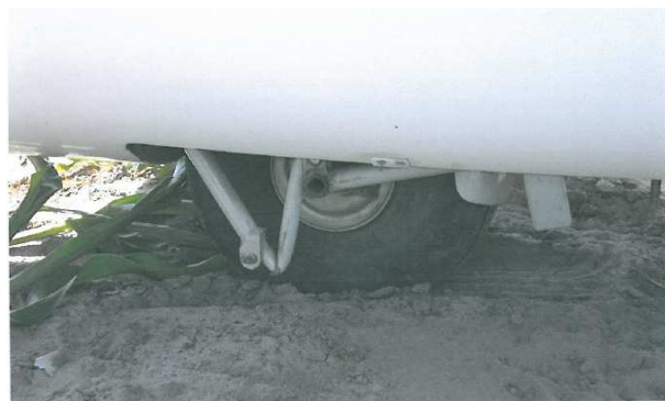
Rys. 4 Widok na podwozie z lewej strony.