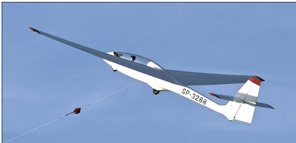
1 – Szybowiec SZD-50-3 Puchacz SP-3288 sfotografowany w okresie poprzedzającym wypadek.