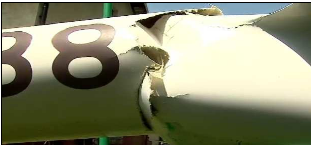
26 – Przełom belki kadłuba z prawej strony – zbliżenie.