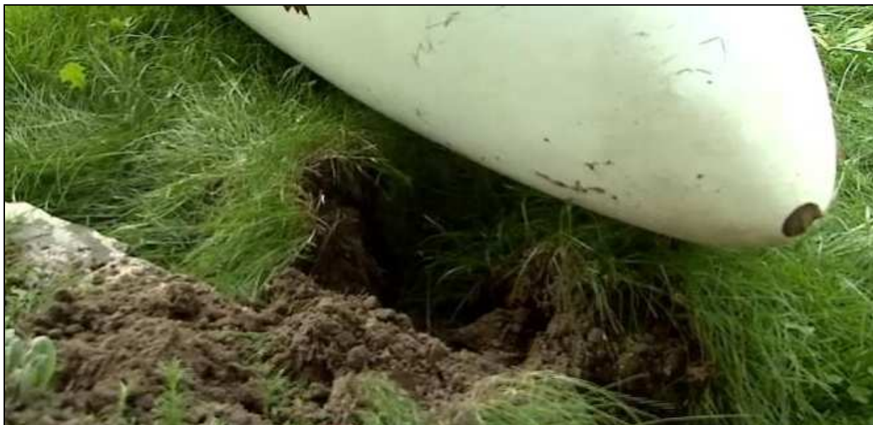
27 – Nosek kadłuba i ślad jego uderzenia w ziemi.