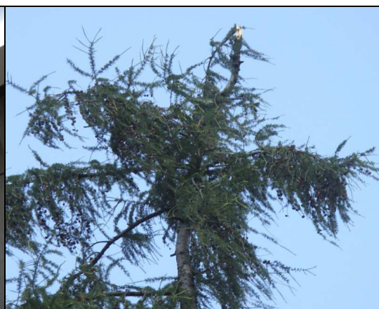
8 – Złamany czubek modrzewia (drzewo A).