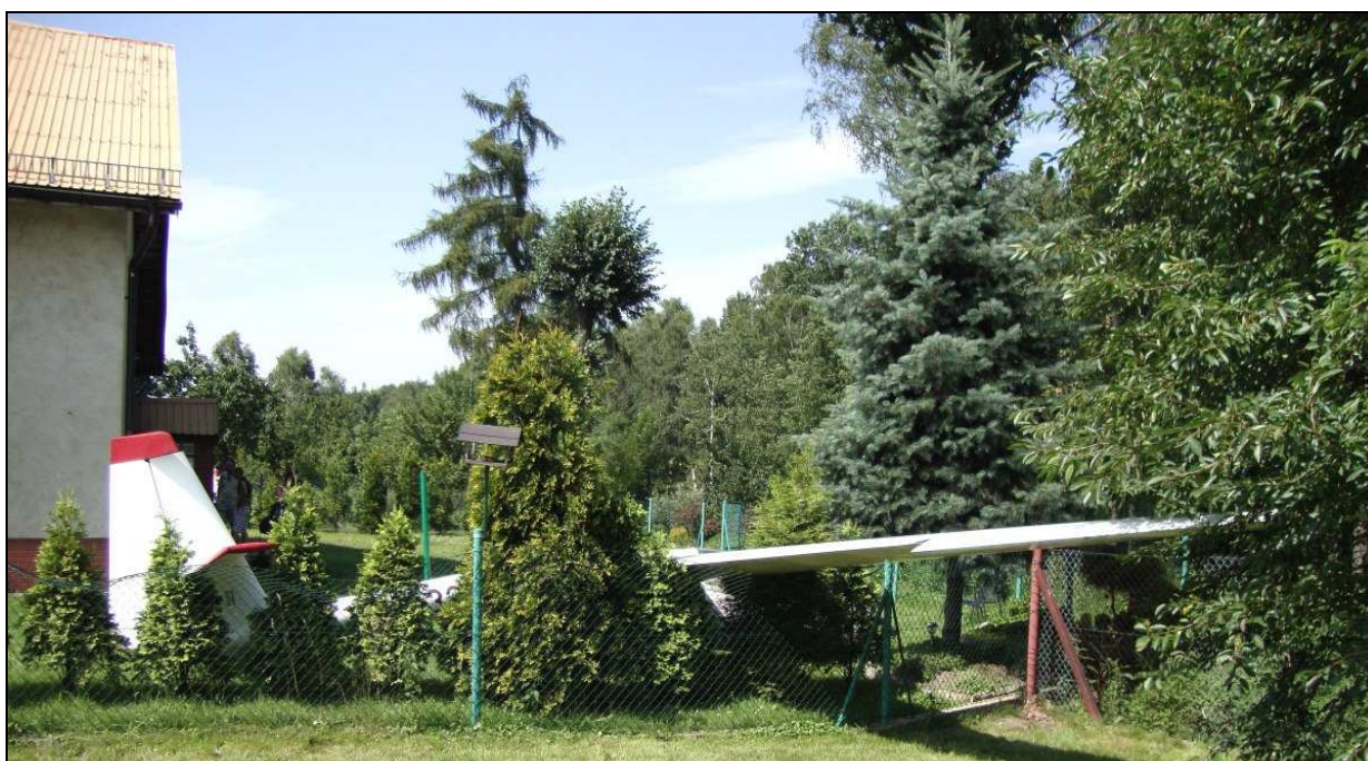
14 – Szybowiec na miejscu wypadku, widok ogólny z prawej strony.