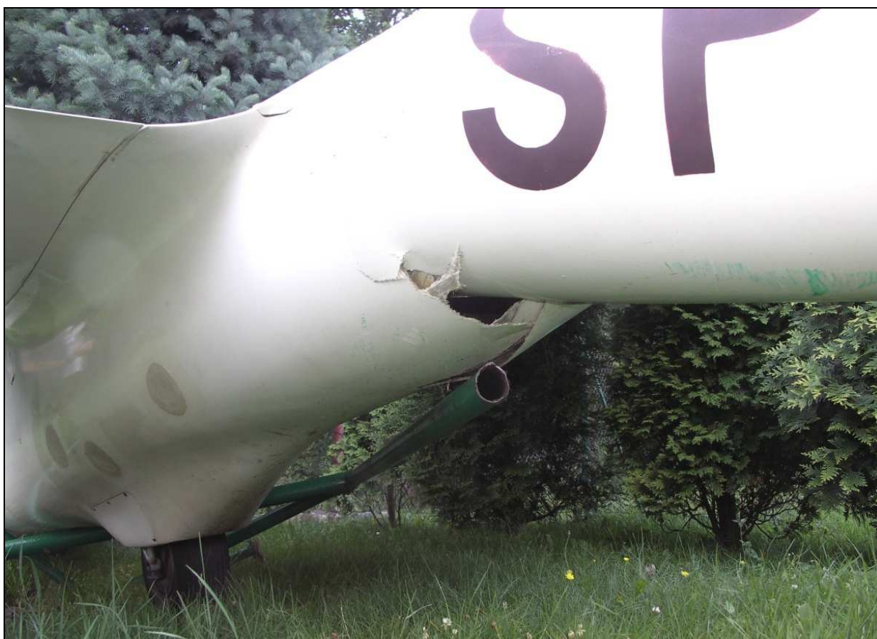
16 – Zbliżenie na środkową część kadłuba za lewym skrzydłem. Widoczne podwozie główne, złamana belka ogonowa i zniszczony trzepak.