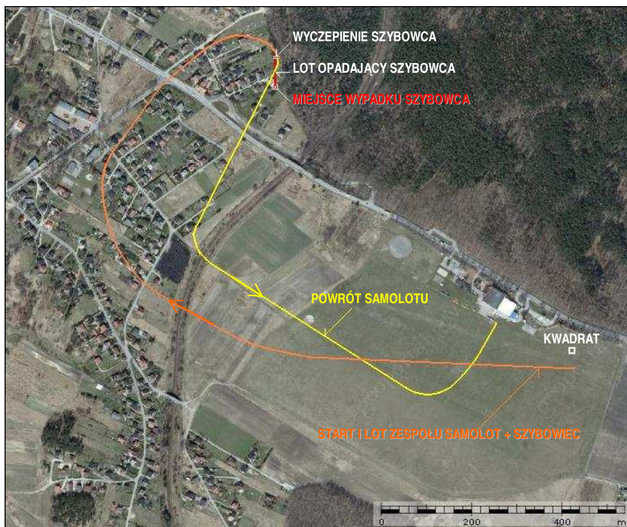
2 – Lotnisko Aeroklubu ROW Rybnik i jego najbliższa okolica, zaznaczono przybliżoną trasę lotu samolotu holującego i szybowca oraz miejsce wypadku.