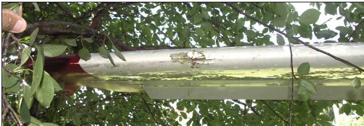
21 – Uszkodzenia krawędzi natarcia końcówki prawego skrzydła.