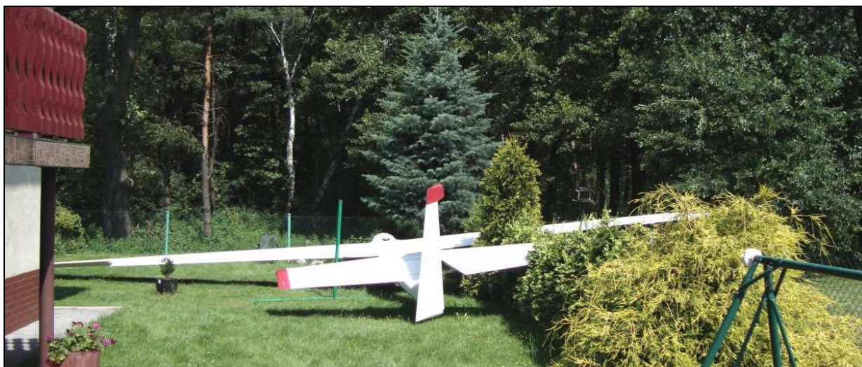
13 – Szybowiec na miejscu wypadku, widok ogólny od tyłu.