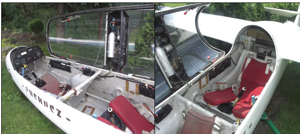
29, 30 – Wnętrze kabiny szybowca po wypadku – brak widocznych uszkodzeń.