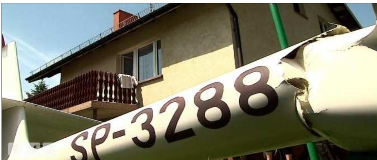
25 – Przełom belki kadłuba z prawej strony od dołu.