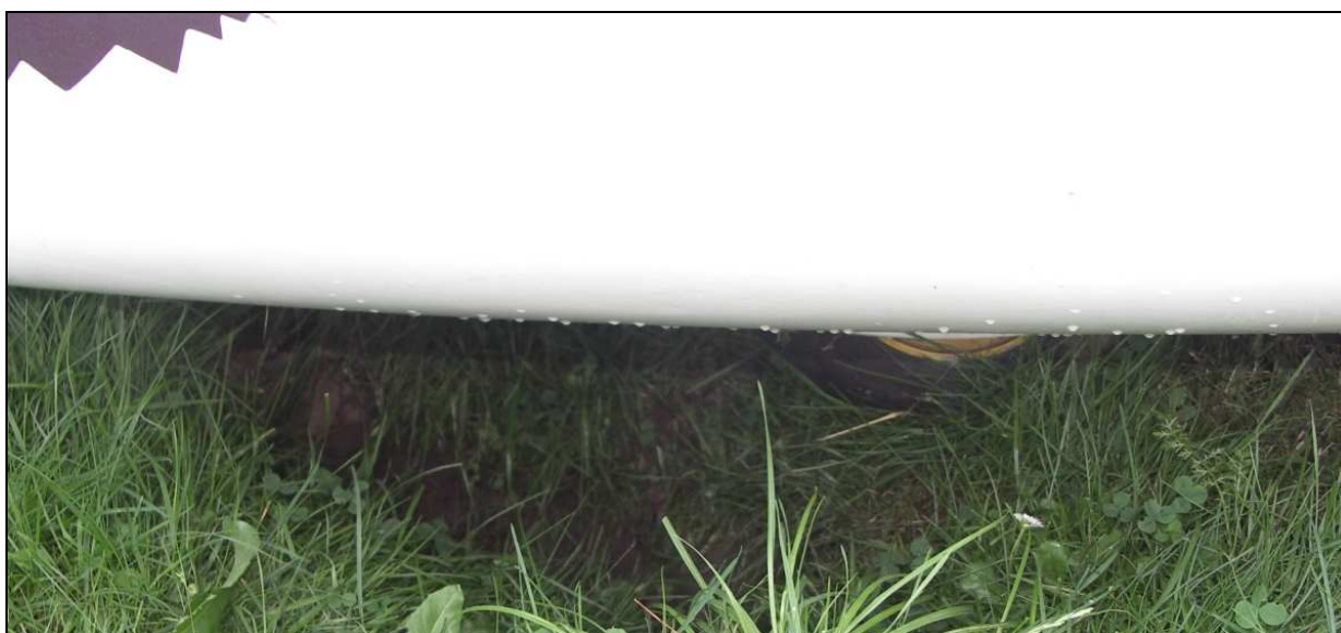
28 – Odcisnięty w gruncie ślad przedniego koła.