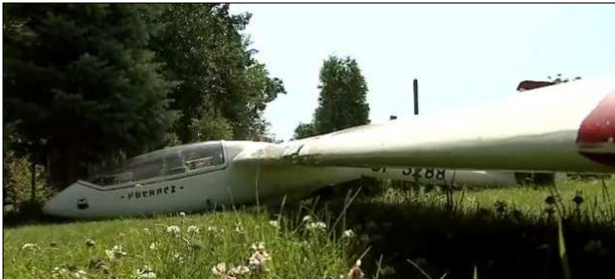
12 – Widok wzdłuż krawędzi natarcia lewego skrzydła – widoczne uszkodzenia po kolizji z drzewem.