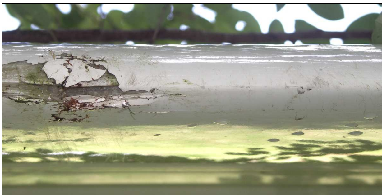
22 – Uszkodzenia krawędzi natarcia końcówki prawego skrzydła - zbliżenie.