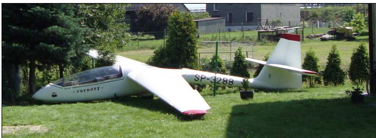
10 – Szybowiec na miejscu wypadku, widok ogólny z lewej strony.