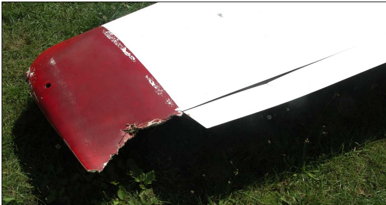
24 – Uszkodzenia końcówki lewego skrzydła i lewej lotki (złamanie).