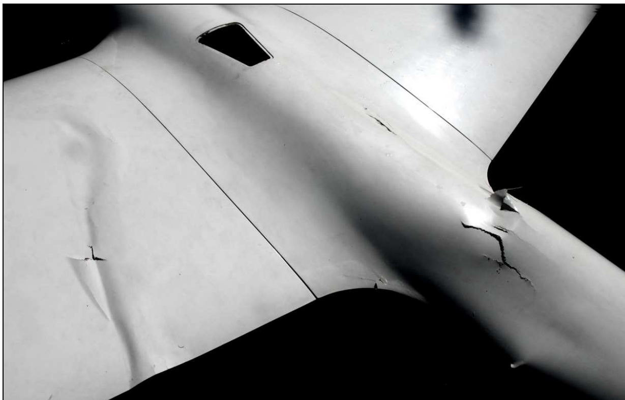
19 – Widok z góry na nasadowe części skrzydeł i belkę kadłuba za skrzydłami. Widoczne uszkodzenia lewego skrzydła i złamanie kadłuba.