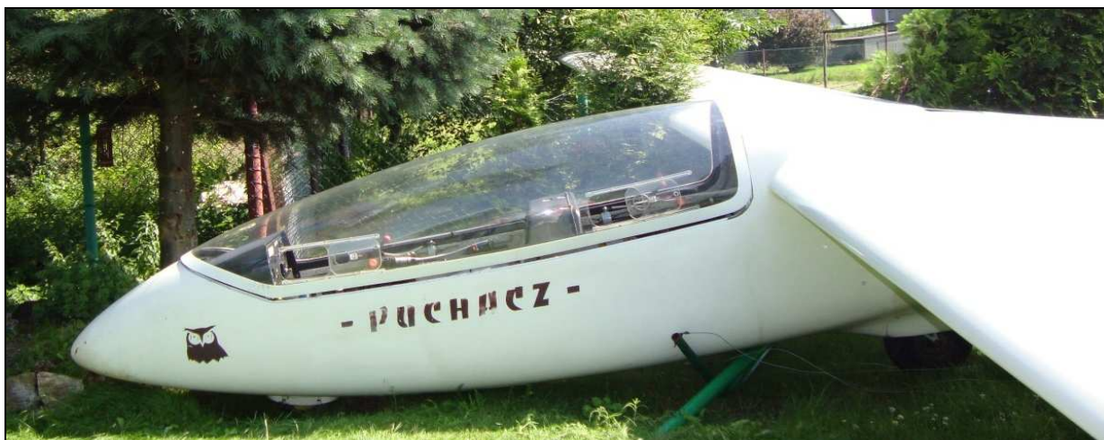
11 – Zbliżenie na przednią część kadłuba z lewej strony, pod kadłubem widoczny zniszczony trzepak.