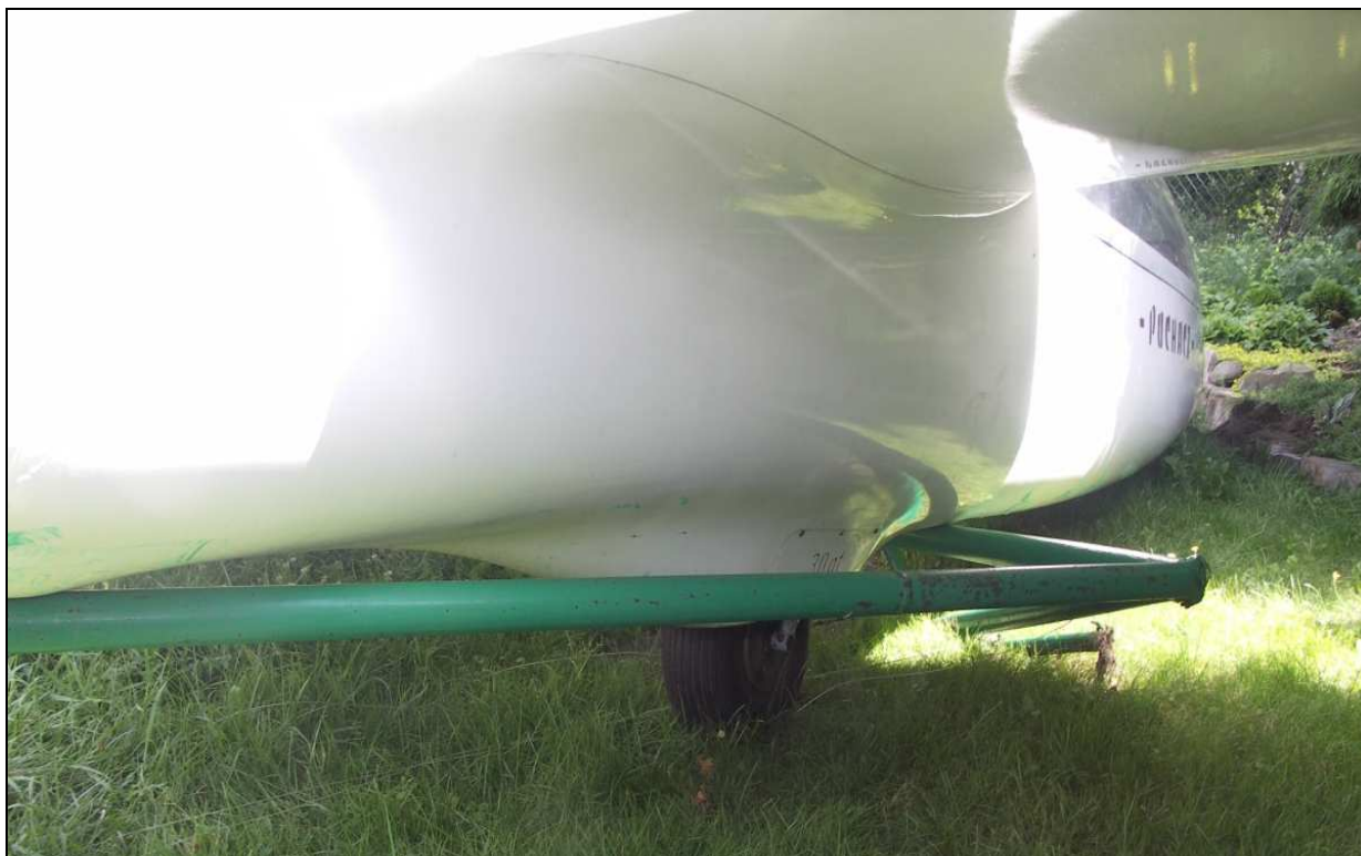
17 – Zbliżenie na środkową część kadłuba pod prawym skrzydłem. Widoczne podwozie główne i zniszczony trzepak.