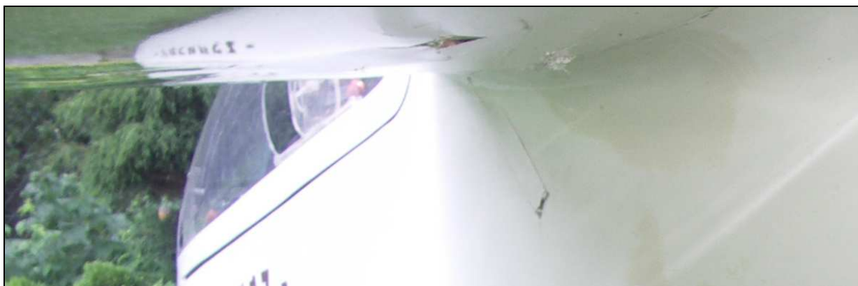
23 – Uszkodzenia dolnego pokrycia lewego skrzydła u nasady.