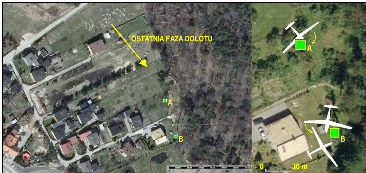
3 – Ostatnia faza lotu szybowca, zaznaczone miejsca kolizji z drzewami: A – prawym skrzydłem, B – lewym skrzydłem