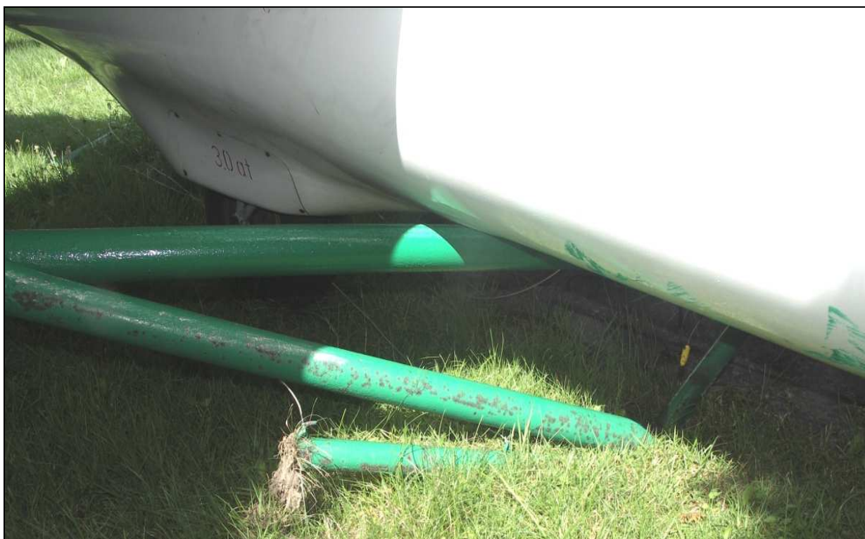
18 – Zbliżenie na środkową część kadłuba pod prawym skrzydłem. Widoczne podwozie główne i zniszczony trzepak.