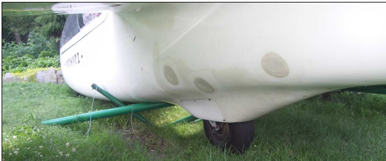
15 – Zbliżenie na środkową część kadłuba pod lewym skrzydłem. Widoczne podwozie główne i zniszczony trzepak.