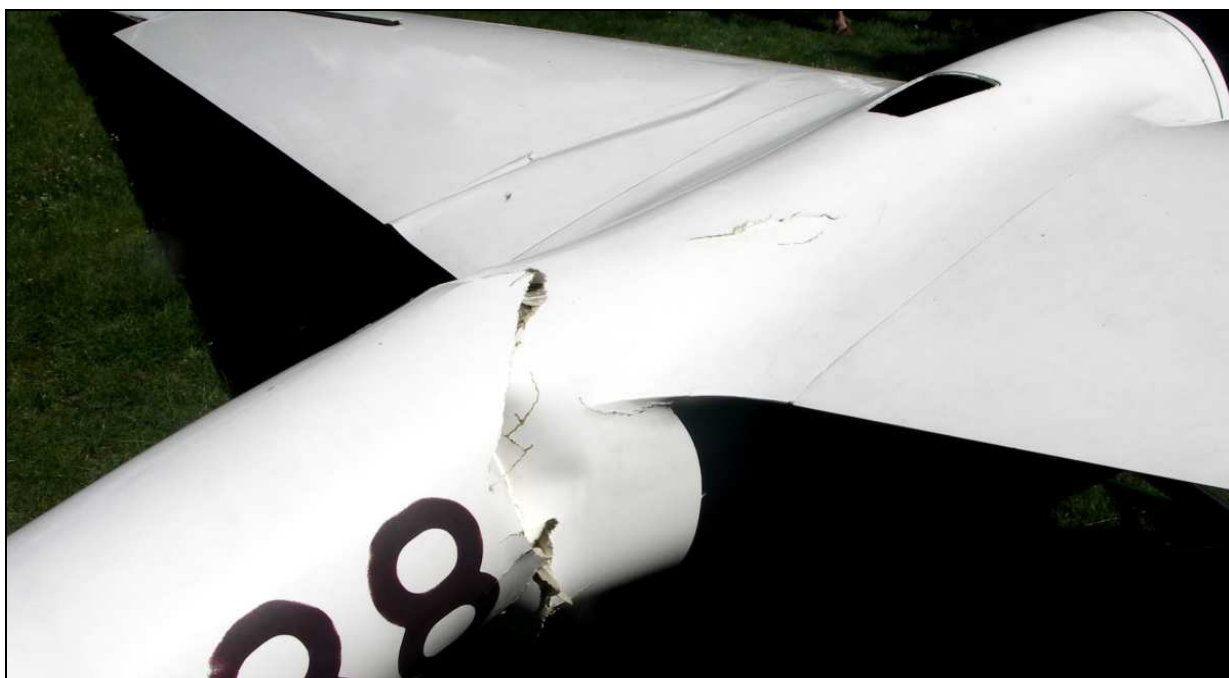
20 – Widok z lewej strony na nasadowe części skrzydeł i belkę kadłuba za skrzydłami. Widoczne uszkodzenia lewego skrzydła i złamanie kadłuba.