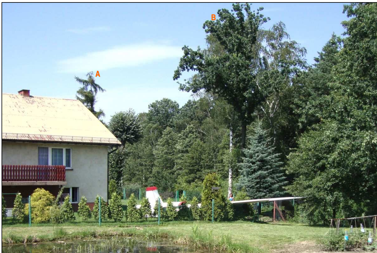
9 – Widok na miejsce wypadku w kierunku zbliżonym do północnego. Oznaczenia jak na fot.3.