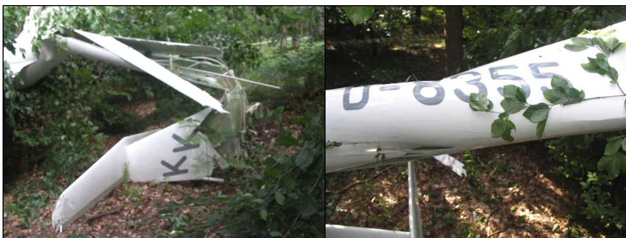
14 – Zniszczone usterzenie.