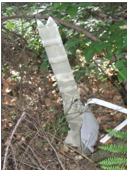
18 – Fragment struktury skrzydła.