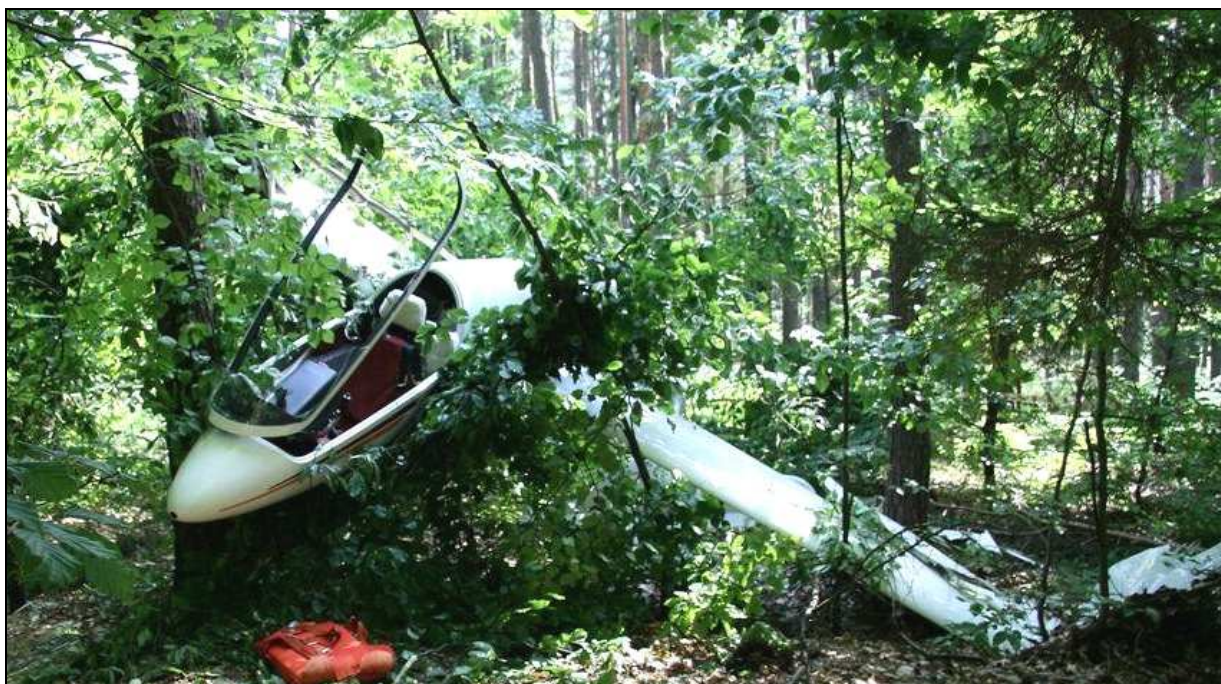
6 – Zniszczony szybowiec \frac{3}{4} od przodu z lewej – widoczne połamane lewe skrzydło.