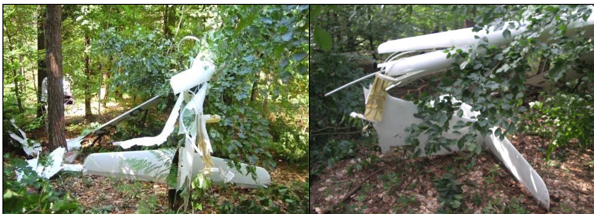
12, 13 – Zniszczone usterzenie.