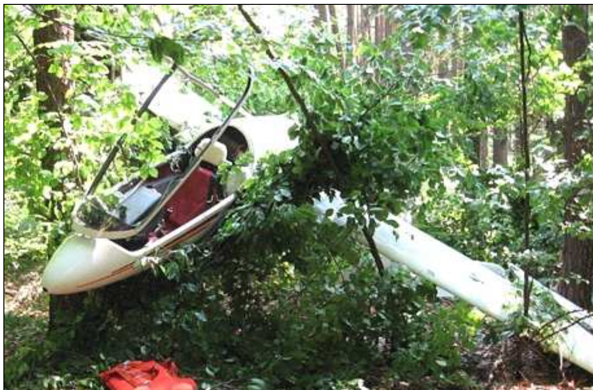
4 – Ogólny widok szybowca na miejscu wypadku.