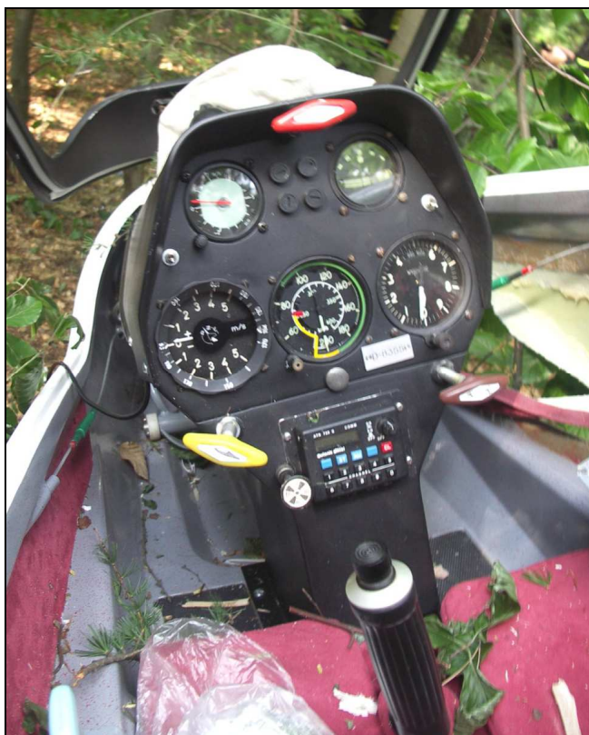
16 – Wnętrze kabiny i tablica przyrządów.