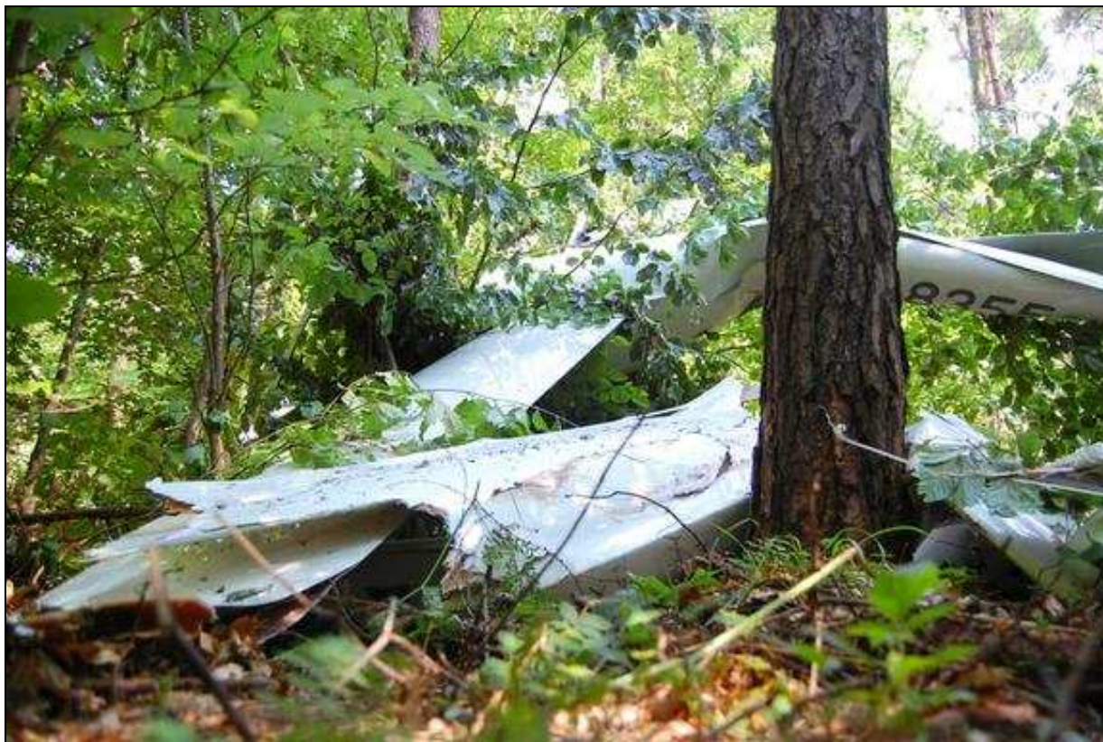
9 – Połamane lewe skrzydło.