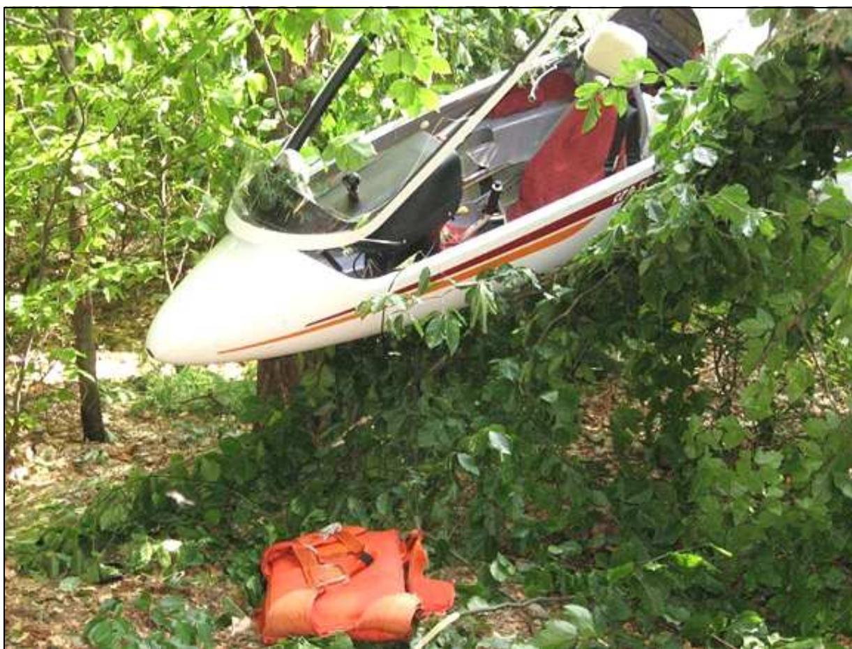
7 – Kabina szybowca, pod nią spadochron pilota.