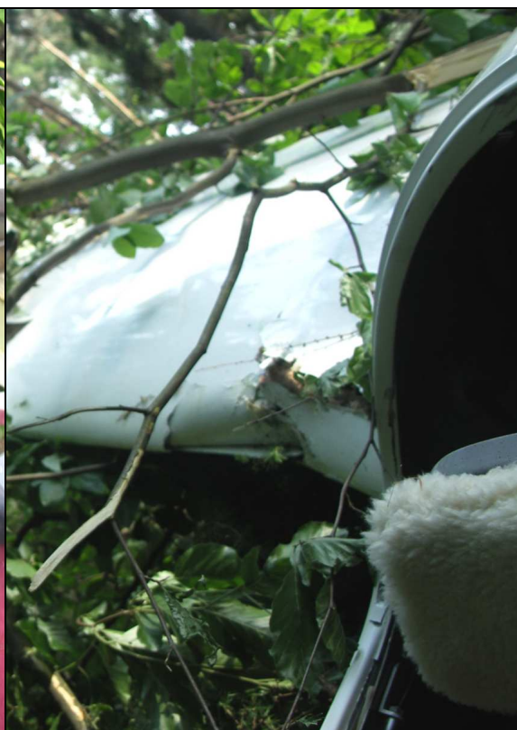
17 – Uszkodzenie noska prawego skrzydła przy kadłubie.