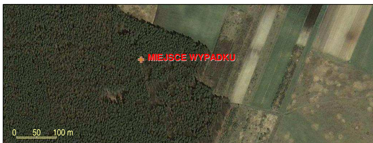
3 – Otoczenie miejsca wypadku na fotomapie kolorowej. Współrzędne miejsca wypadku wg GPS: N50°38'12" / E017°46'06" / H=201 m AMSL.