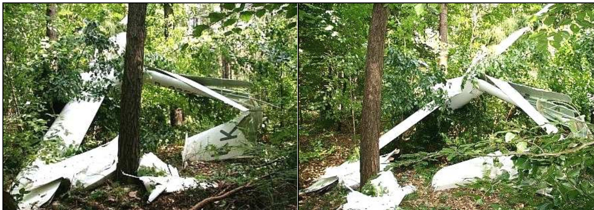
10, 11 – Ogólny widok na zniszczoną tylną część kadłuba.