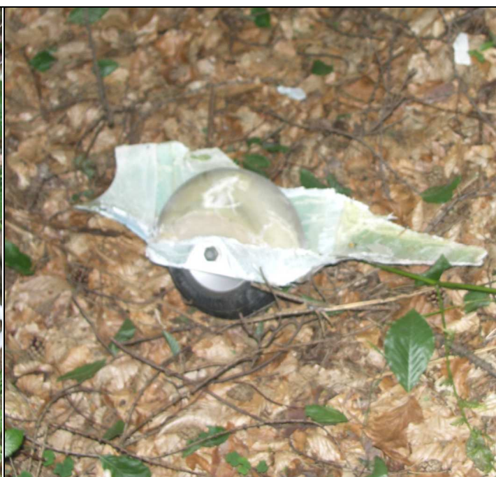
19 – Wyrwane z kadłuba tylne kółko podporowe.