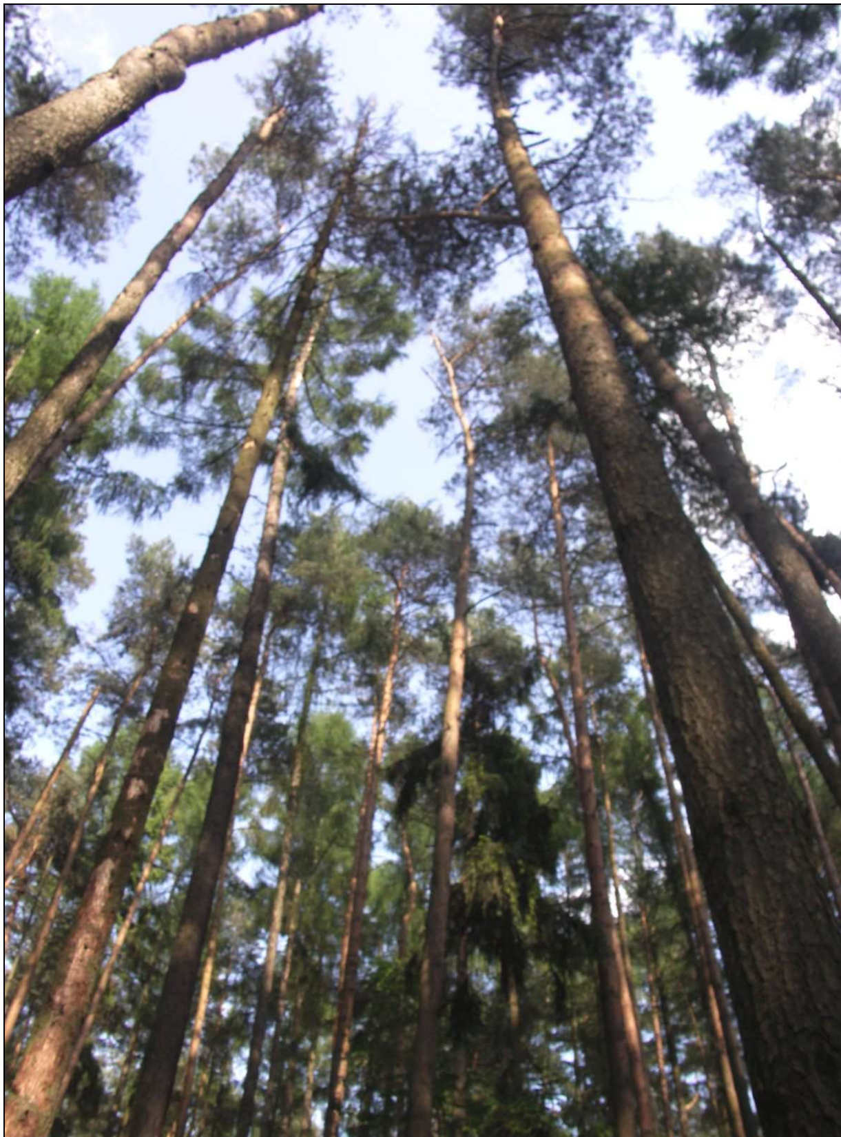
5 – Drzewa, między które wpadł szybowiec.