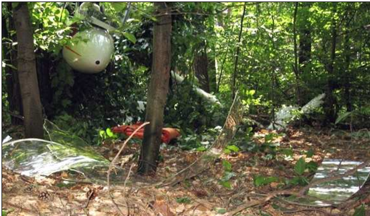
8 – Szczątki potłuczonego oszklenia osłony kabiny.