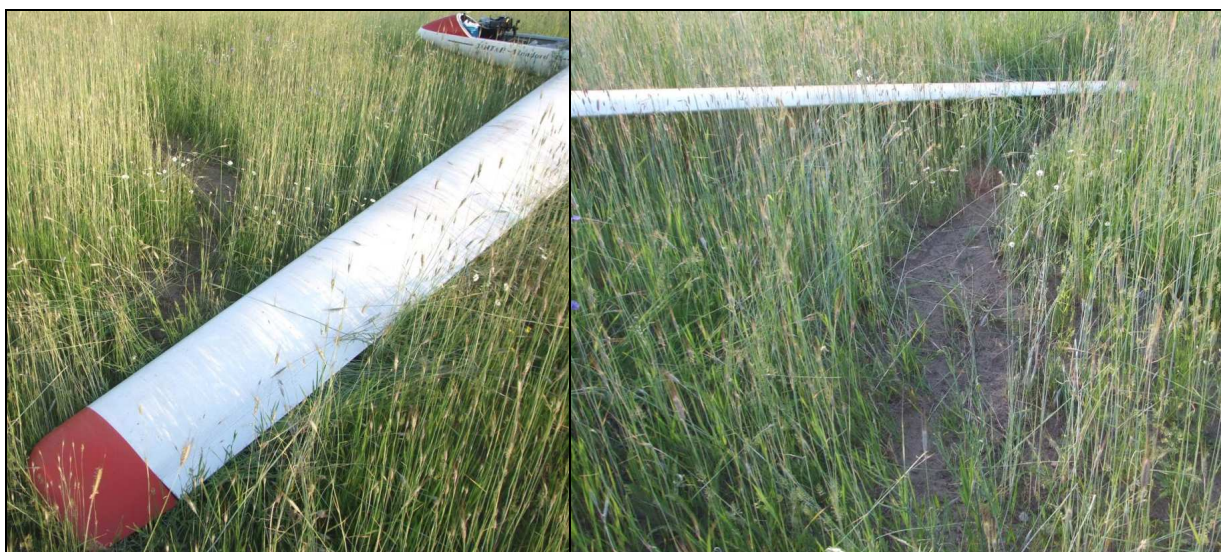
11 – Lewe skrzydło szybowca w zbliżeniu. Zwracają uwagę ślady skrzydła w miejscu lądowania.