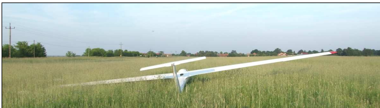
14 – Szybowiec w widoku od tyłu. Widoczne naruszenie geometrii płatowca.