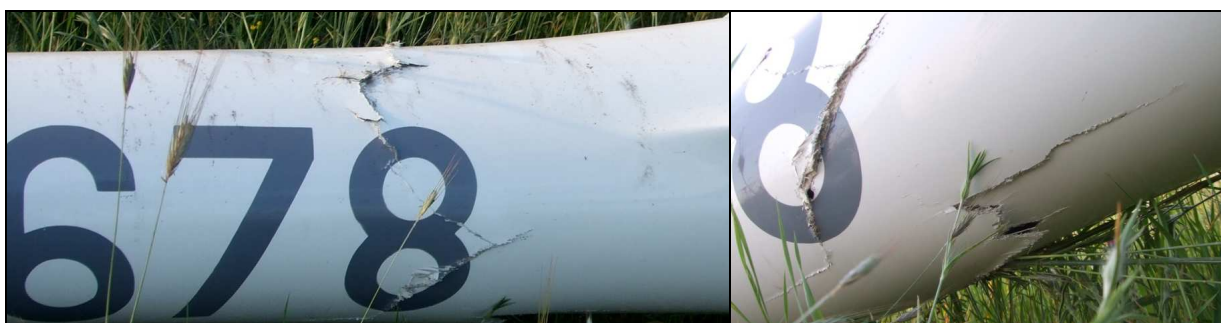
23, 24 – Zbliżenia na przełom belki ogonowej z prawej i lewej strony.