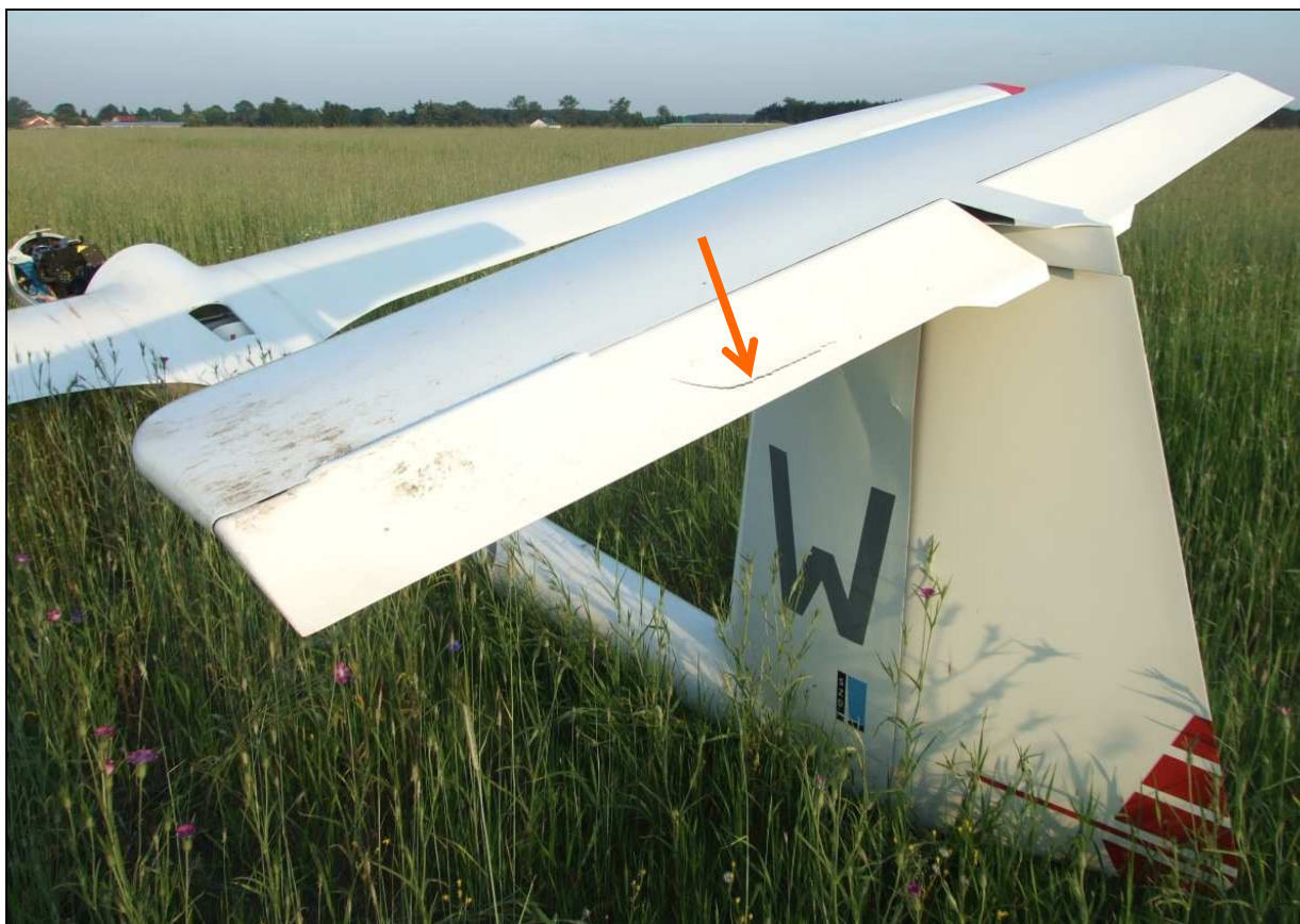
18 – Zbliżenie na usterzenie szybowca. Widoczne uszkodzenie steru wysokości.