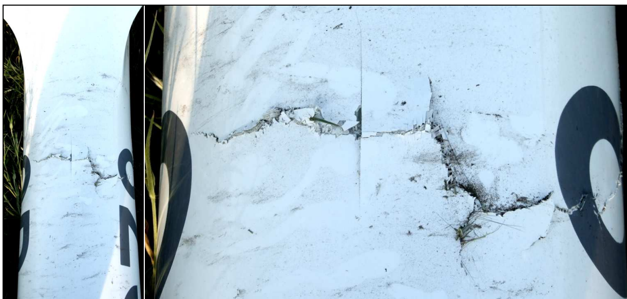
21, 22 – Zbliżenia od góry na przełom i rozklejenie połówek belki ogonowej.