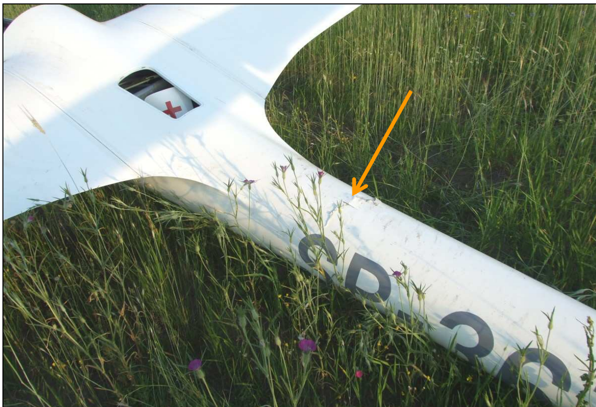
20 – Zbliżenie na środkową część kadłuba. Widoczne zniszczenie (ukręcenie) belki ogonowej.