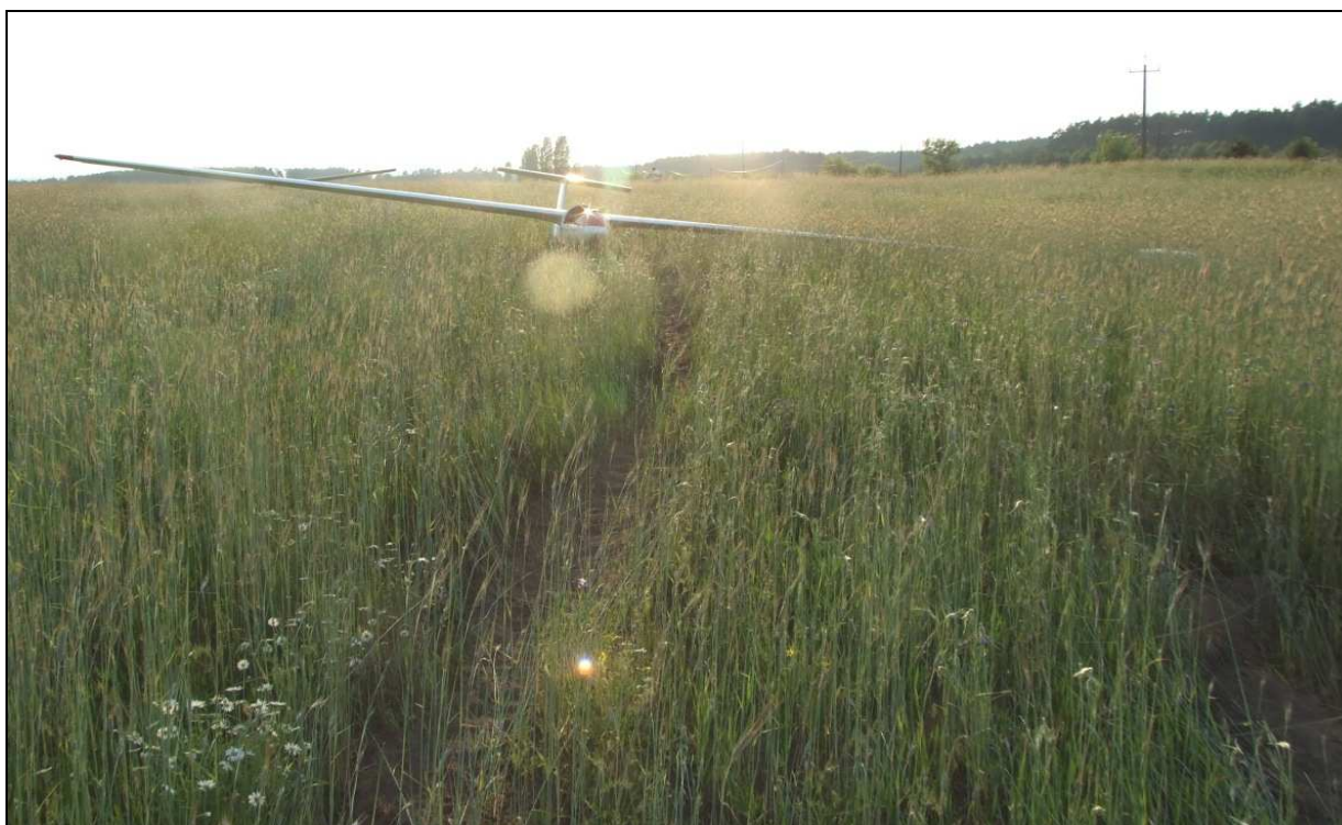
9 – Widok miejsca lądowania w kierunku zachodnim (zbliżonym do kierunku lądowania). Na pierwszym planie widoczny szybowiec SP-3678, na dalszym – SP-3329. Zwracają uwagę ślady lądowania szybowca SP-3678.