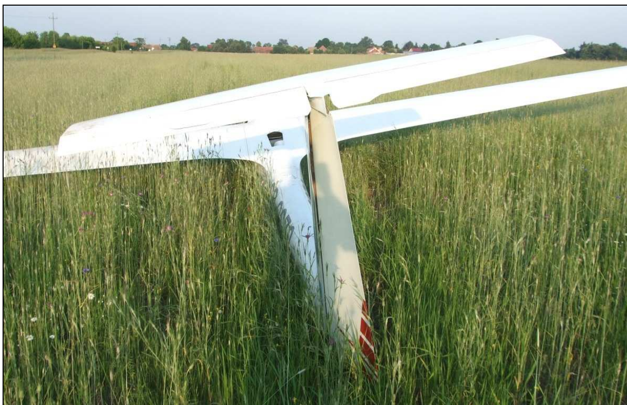
17 – Zbliżenie na usterzenie szybowca od tyłu. Widoczne naruszenie geometrii płatowca.