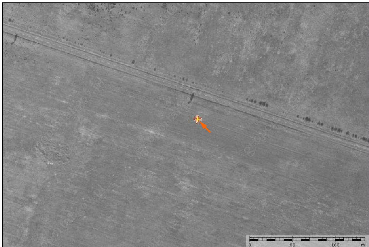
6 – Miejsce wypadku zaznaczone na ortofotomapie najbliższego otoczenia.