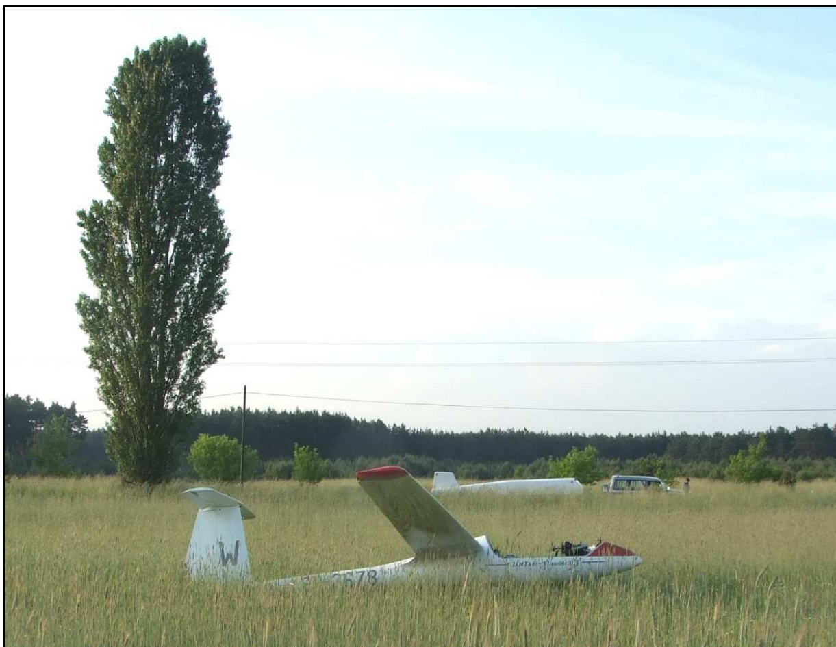
12 – Szybowiec z prawej strony.