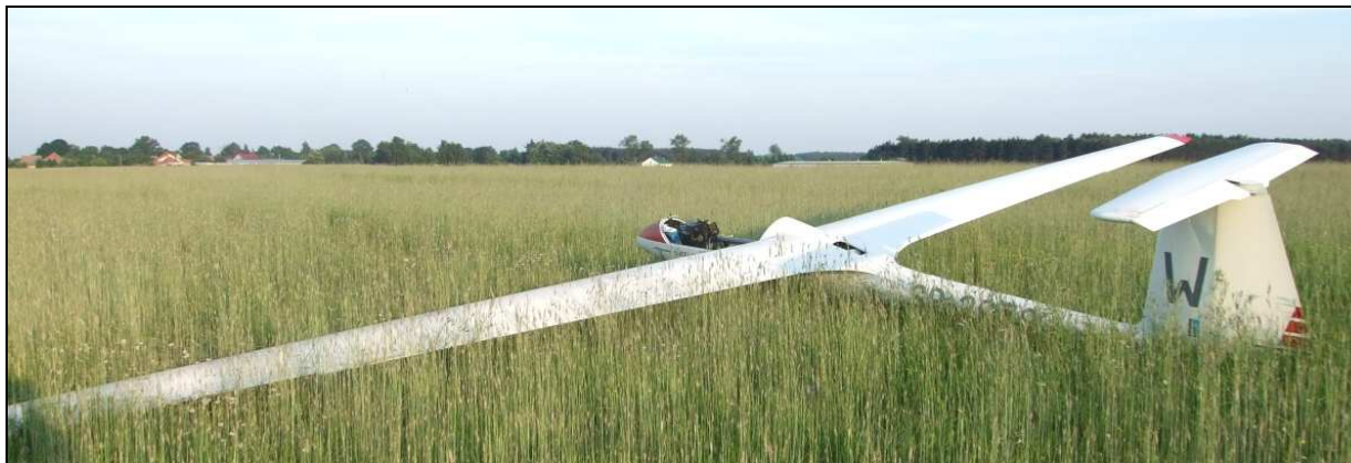
15 – Szybowiec w widoku \frac{3}{4} z lewej strony od tyłu.