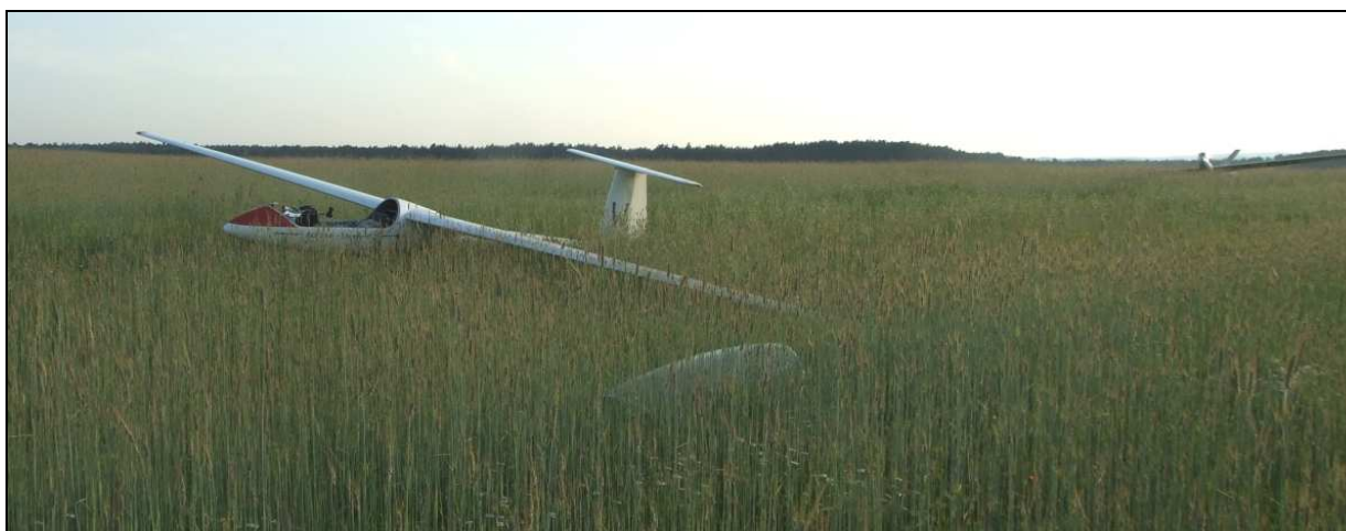
16 – Szybowiec w widoku \frac{3}{4} z lewej strony od przodu.