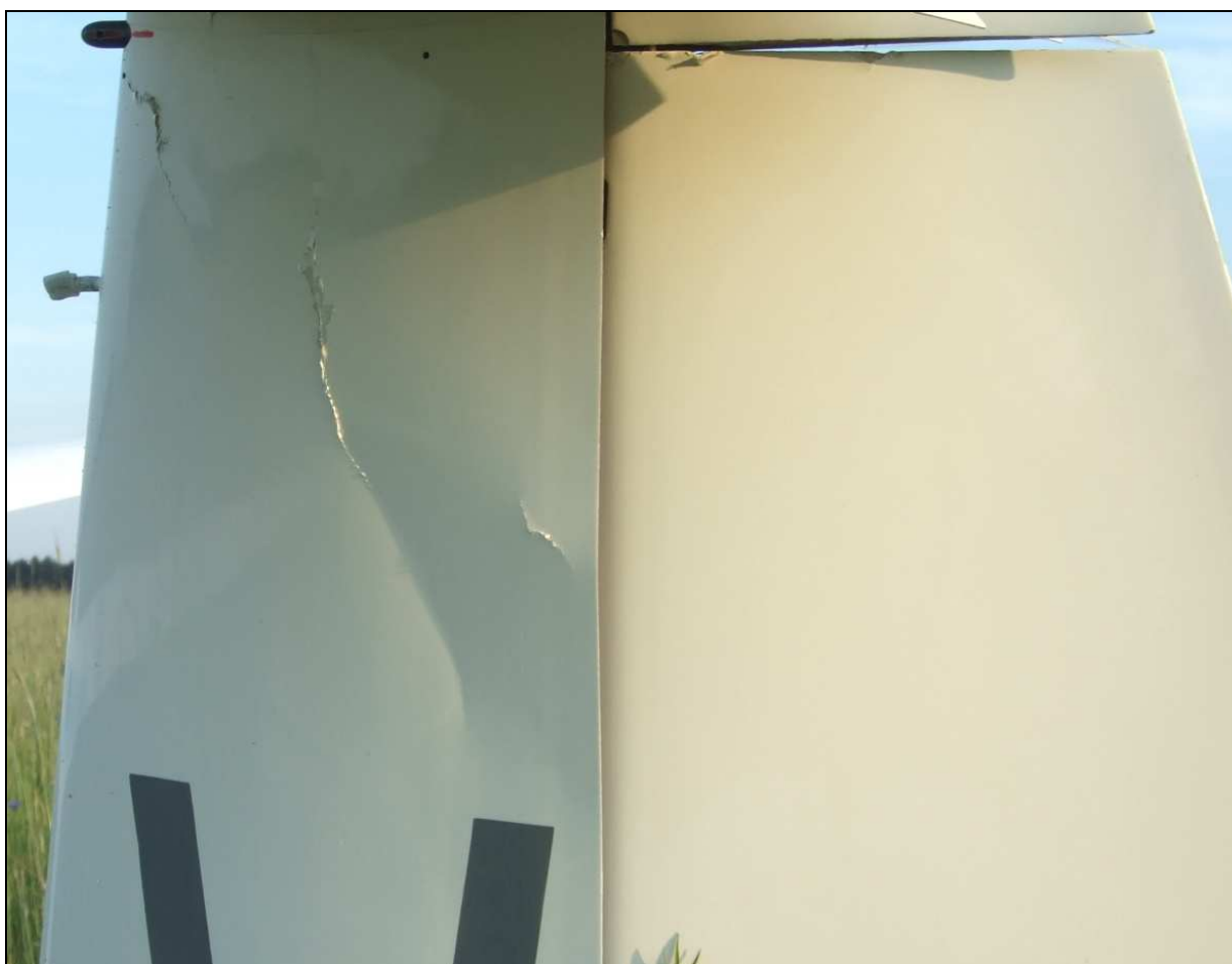
19 – Zbliżenie na usterzenie pionowe szybowca z lewej. Widoczne uszkodzenie pokrycia statecznika pionowego.