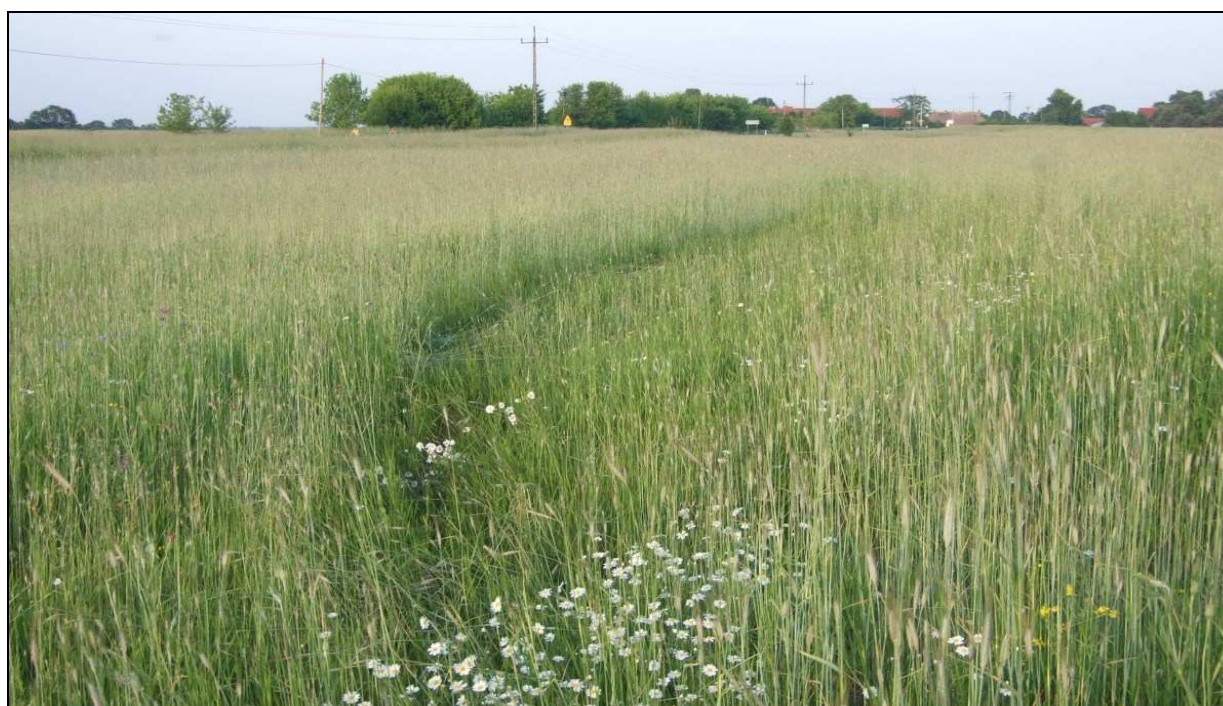
7 – Widok z miejsca zatrzymania się szybowca w kierunku wschodnim ku północy. Widoczny ślad dobiegu.