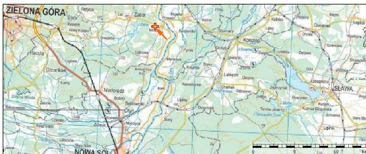
3 – Miejsce wypadku zaznaczone na mapie topograficznej regionu [geoportal].