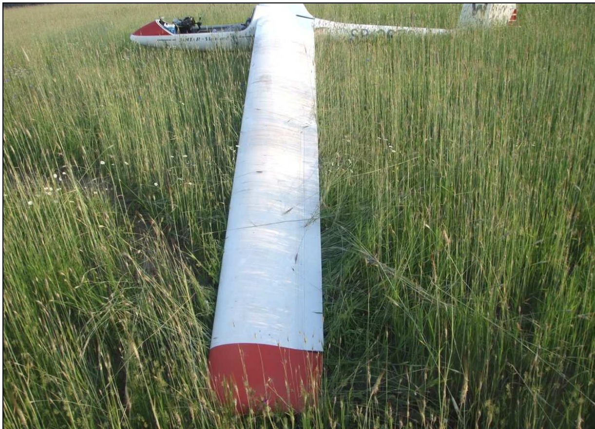
10 – Widok szybowca z lewej strony. Zwracają uwagę ślady skrzydła w miejscu lądowania.