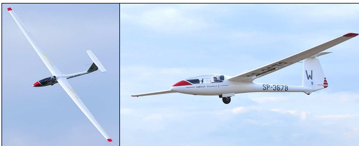
1, 2 – Szybowiec SZD-48-3 Jantar Standard 3 znaki rozpoznawcze SP-3678 sfotografowany w okresie poprzedzającym wypadek.