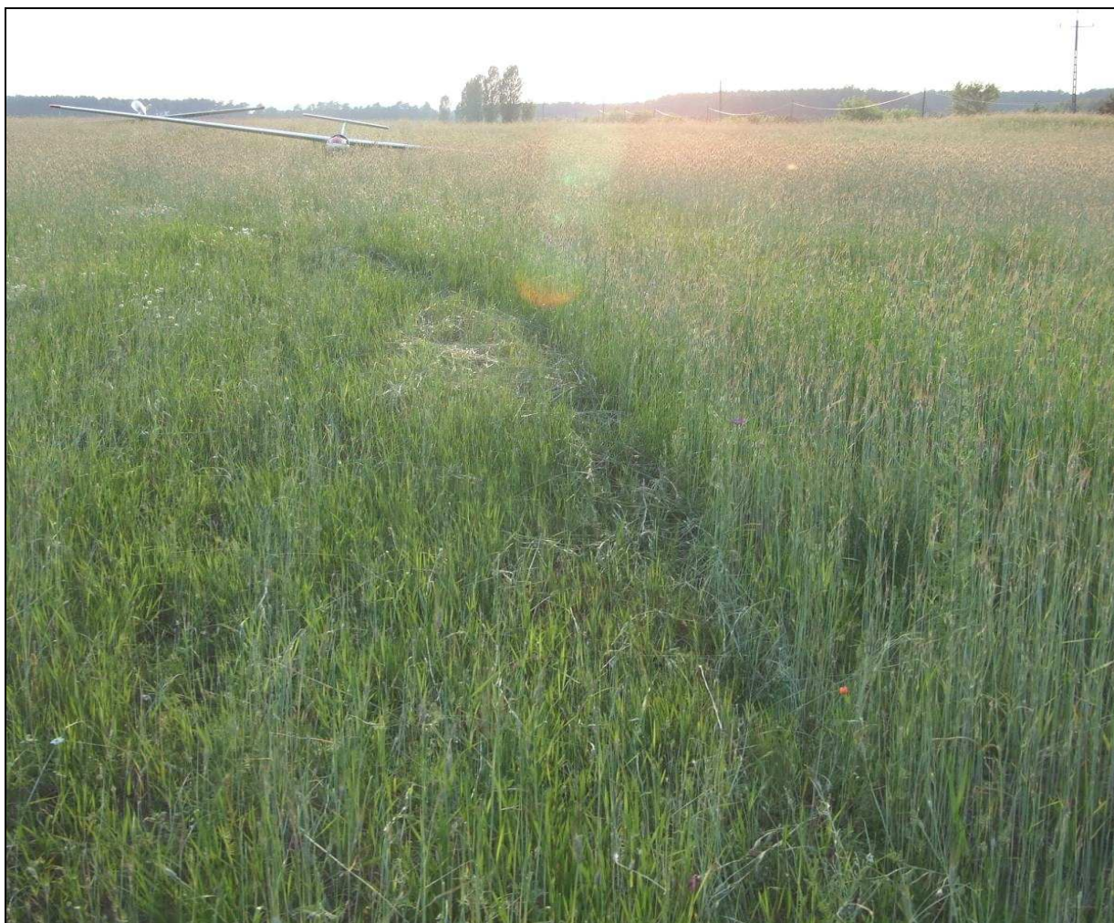
8 – Widok miejsca lądowania w kierunku zachodnim (zbliżonym do kierunku lądowania). Na pierwszym planie widoczny szybowiec SP-3678, na dalszym – SP-3329. Zwracają uwagę ślady lądowania szybowca SP-3678.