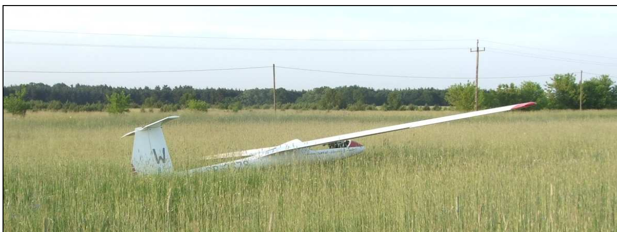
13 – Szybowiec w widoku \frac{3}{4} z prawej strony od tyłu.