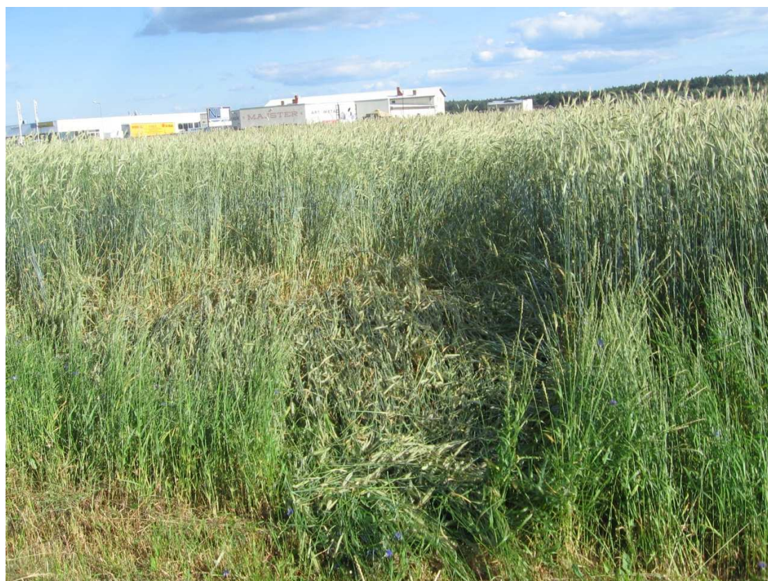
4 – Zniszczony łan żyta (zdjęcie z kierunku przeciwnego do nalogu).