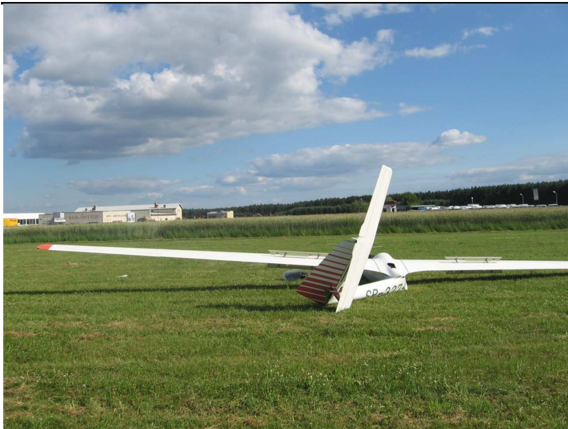
9. Widok z tyłu.