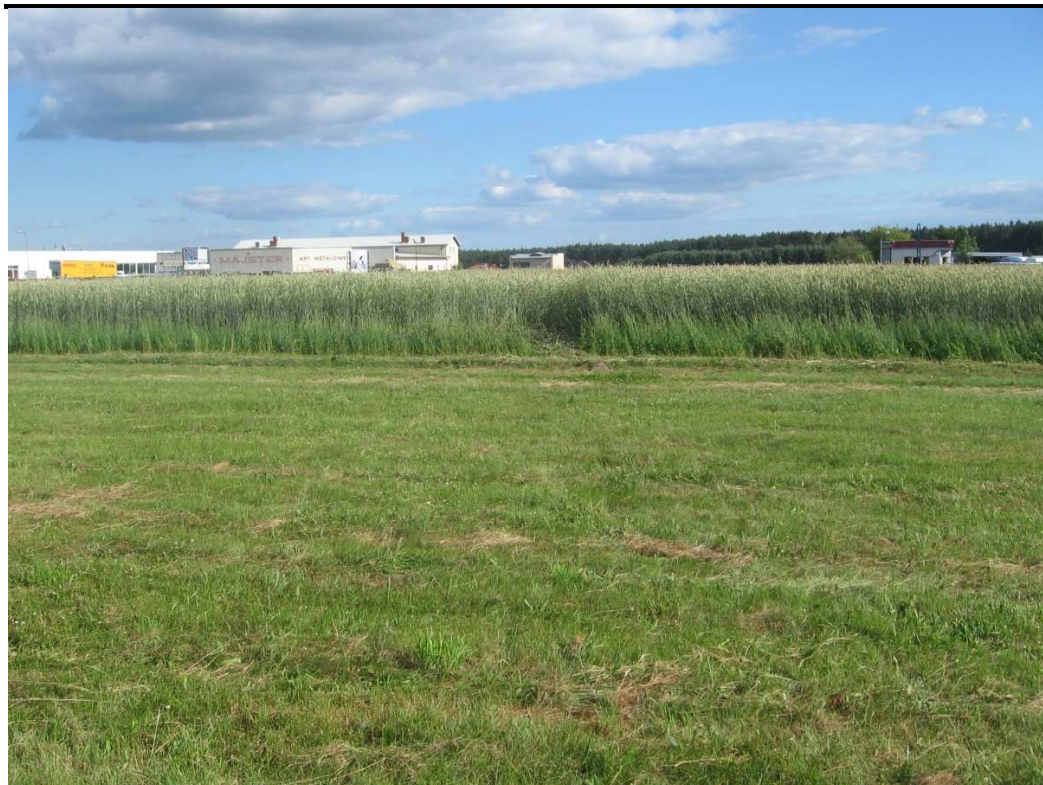
3 – Widok zniszczonego zboża (zdjęcie z kierunku przeciwnego do nalogu).