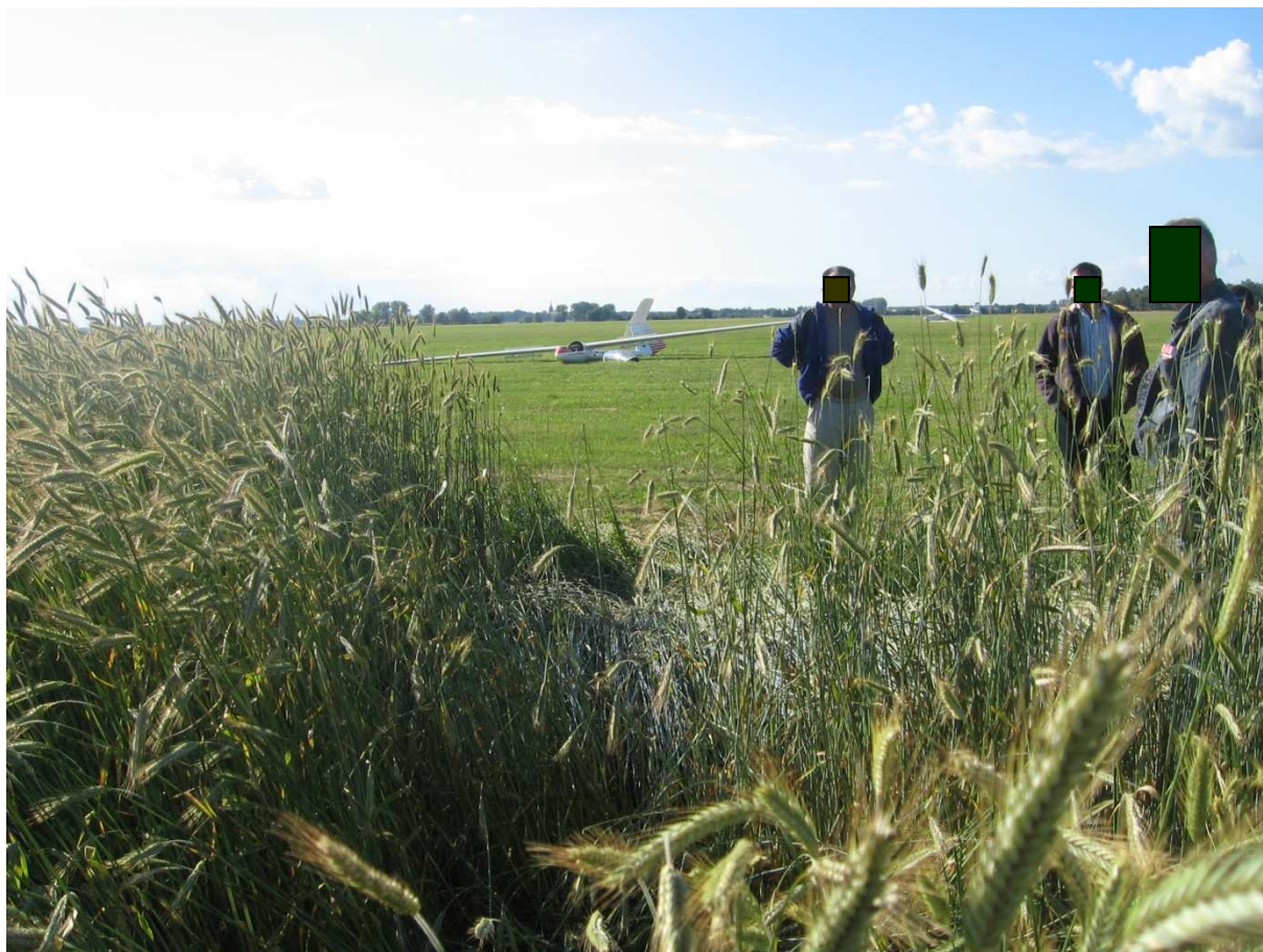
12. Zdjęcie z kierunku nalotu.