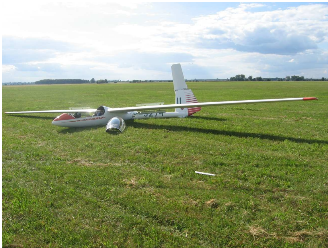
6. Widok szybowca po zatrzymaniu