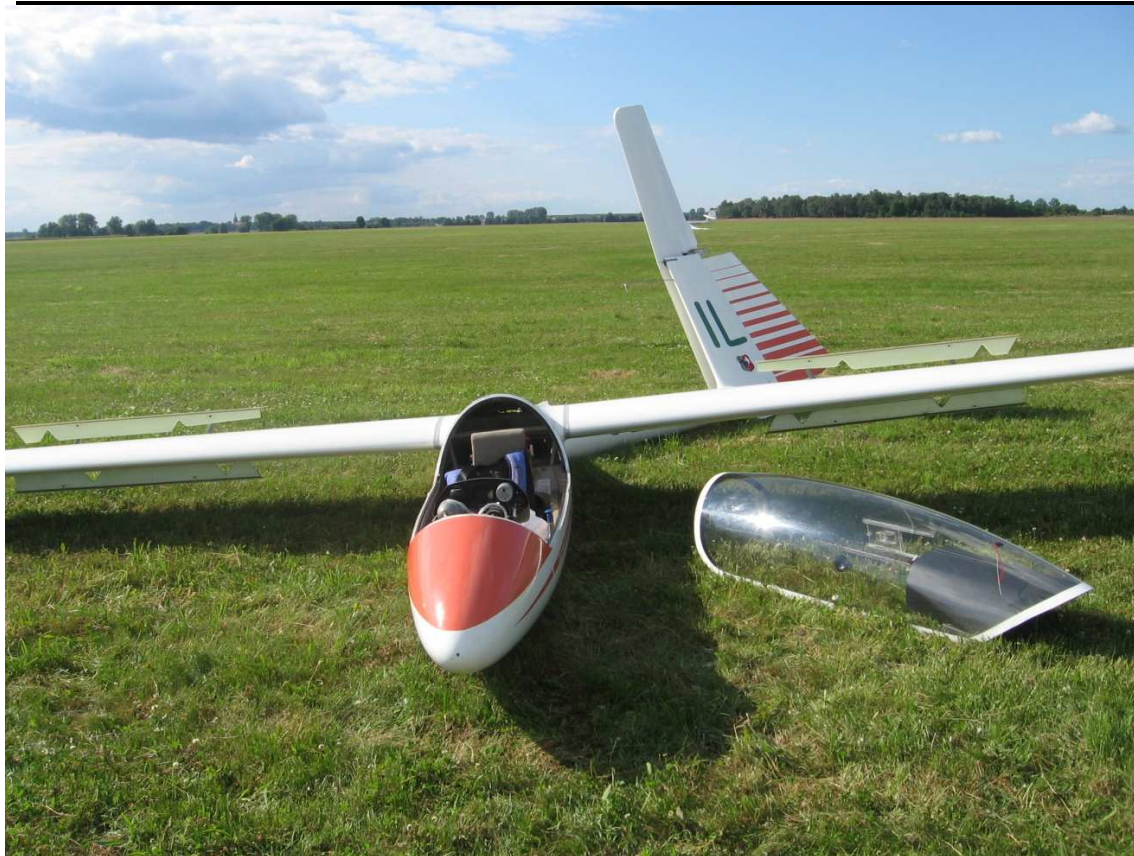
7 –Widok przedniej części szybowca.