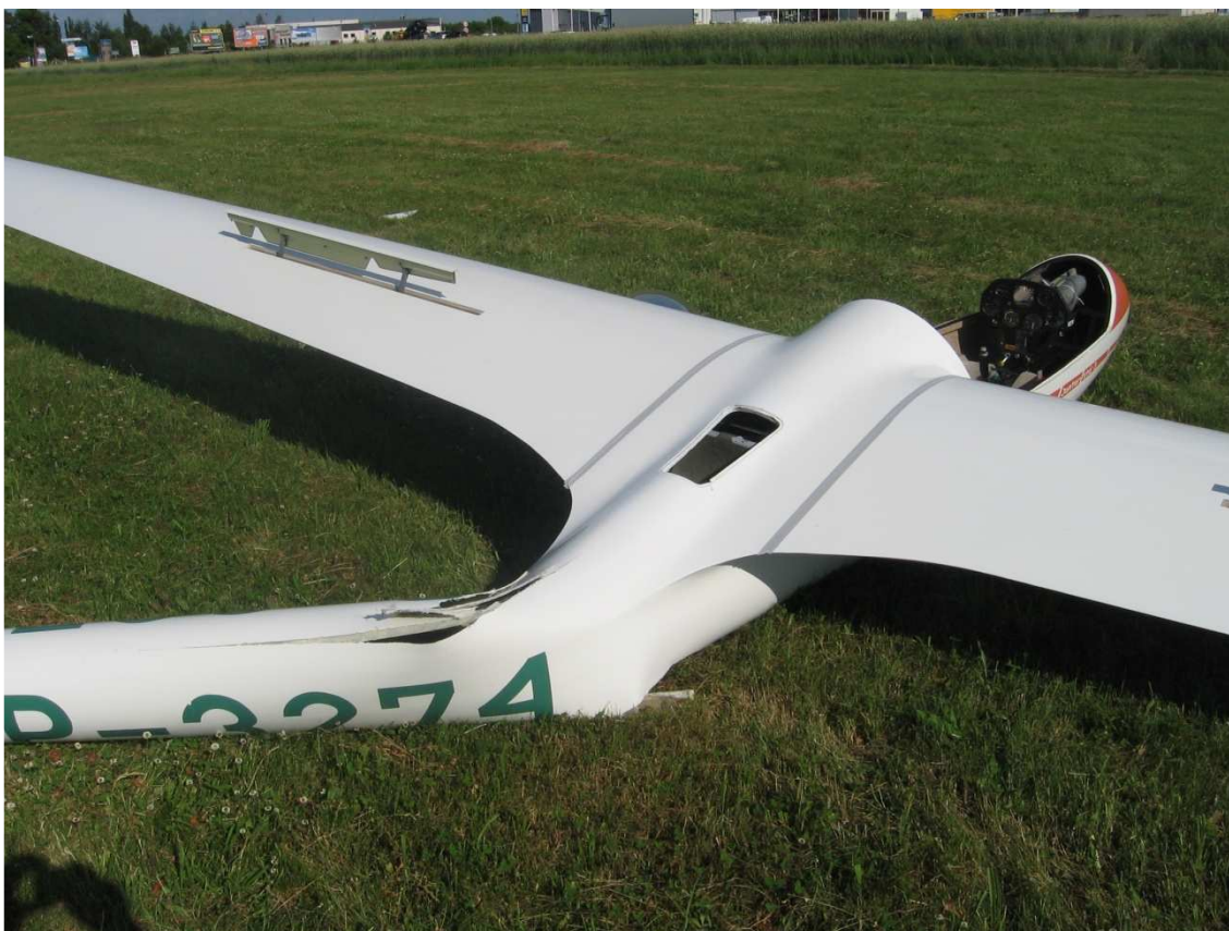
10. Widok z góry.