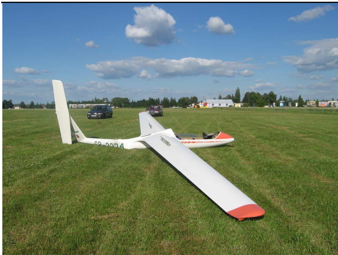
11. Widok z prawej strony.