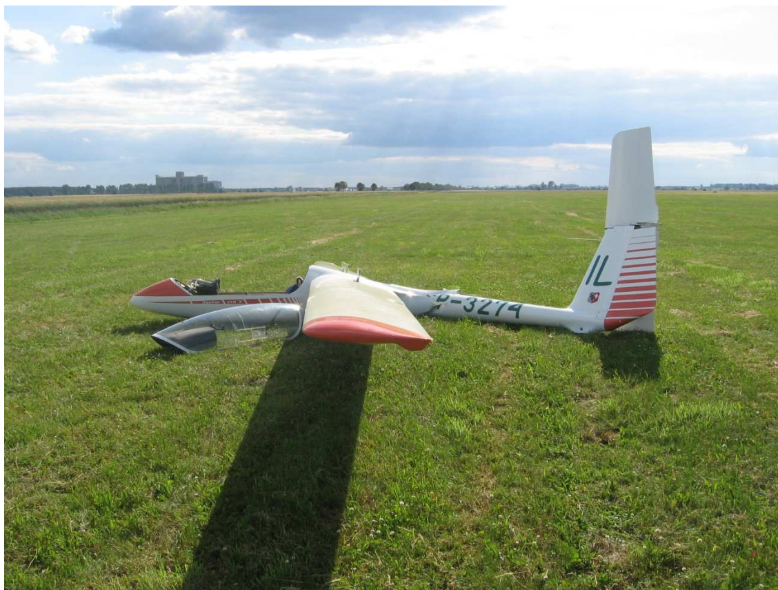
8. Widok z boku.