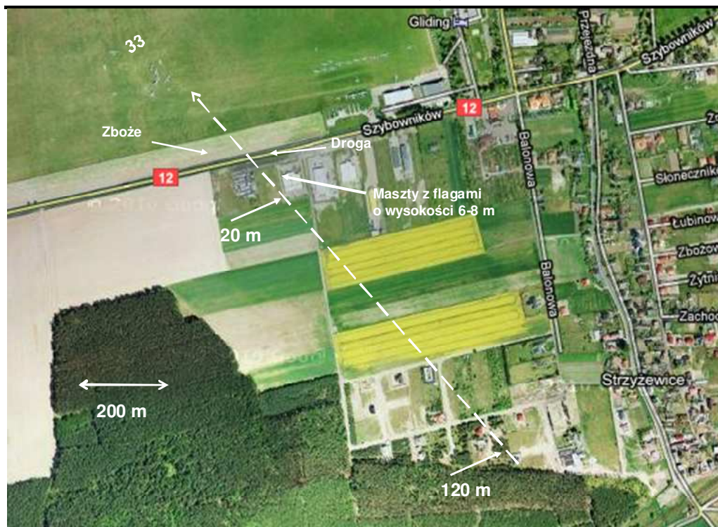
1. Trasa lotu szybowca Jantar po czwartym zakręcie