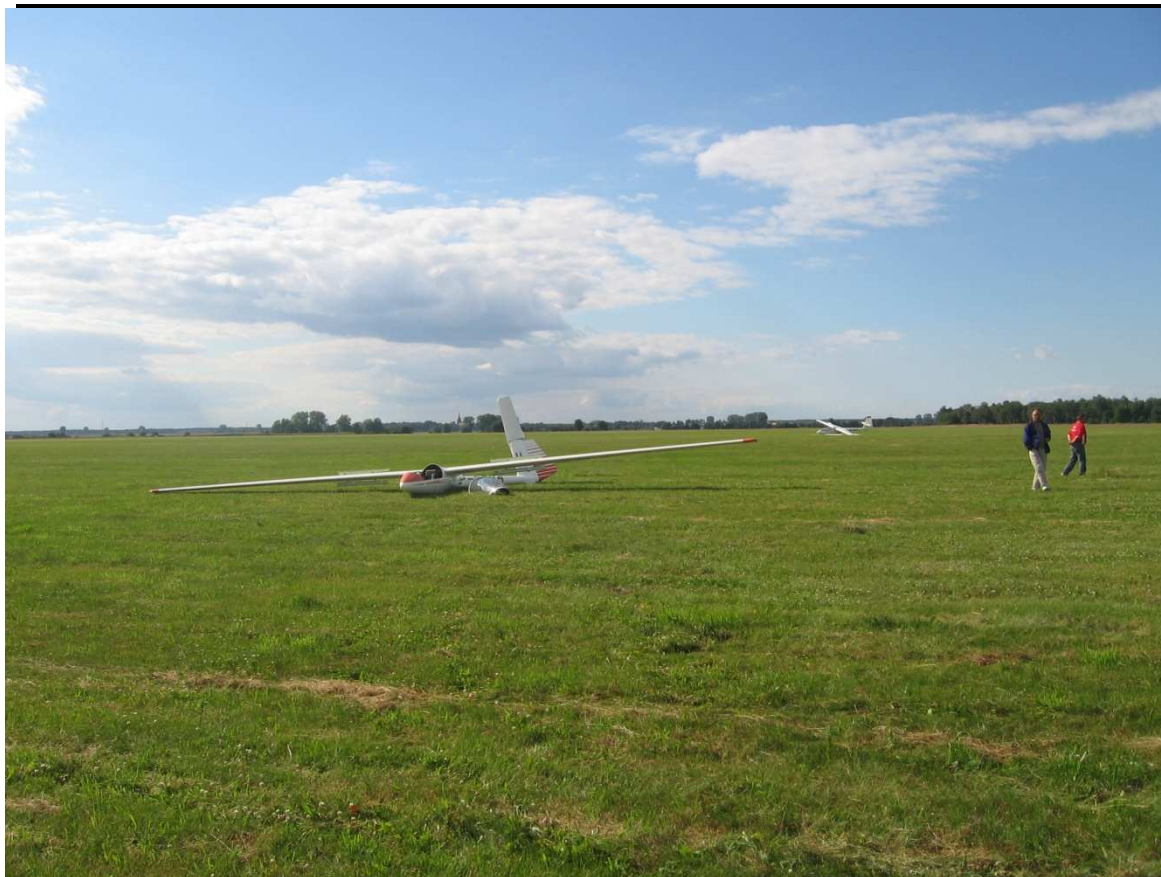
5 – Ogólny widok szybowca na miejscu wypadku (zdjęcie z kierunku nalogu).