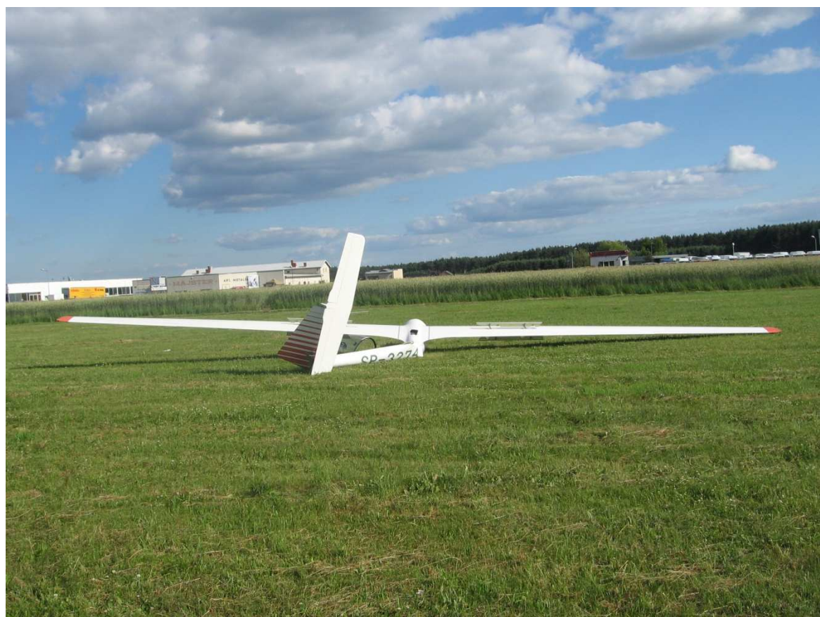
12. Widok z tyłu (zdjęcie z kierunku przeciwnego do kierunku nalotu).