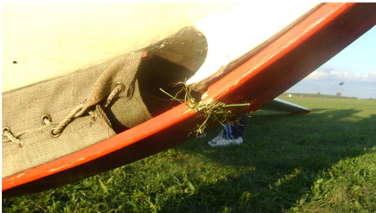
3 – Widok uszkodzonej płozy przedniej szybowca