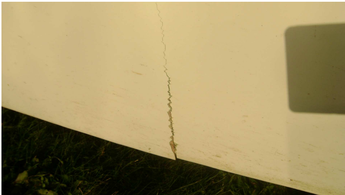
5 – Pęknięcie kadłuba w rejonie podwozia.