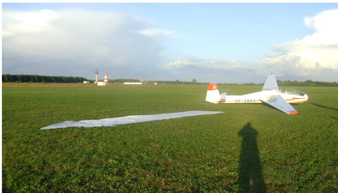
2. Widok ogólny szybowca Jantar po zakończeniu dobiegu