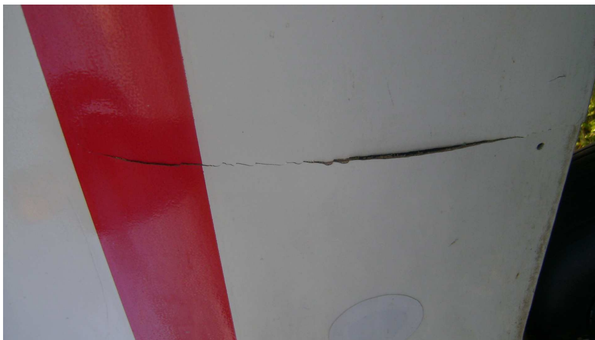
6. Uszkodzony kadłub w miejscu mocowania płoży ogonowej