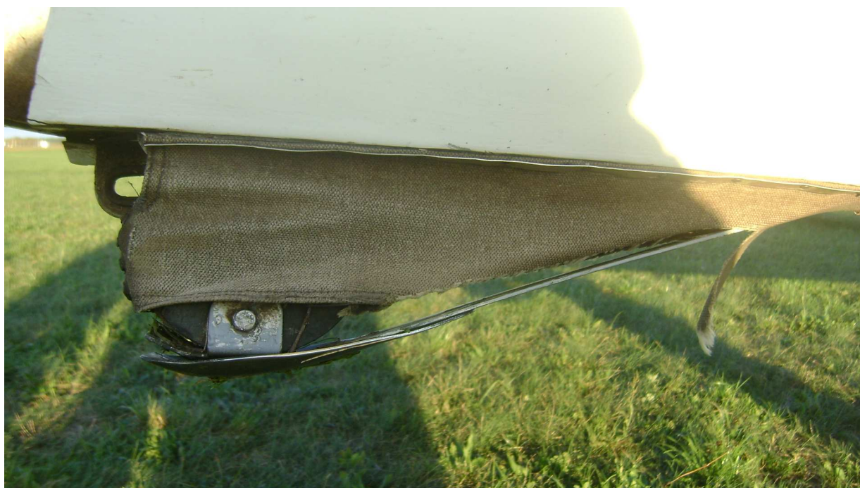
4 – Widok płozy tylnej.