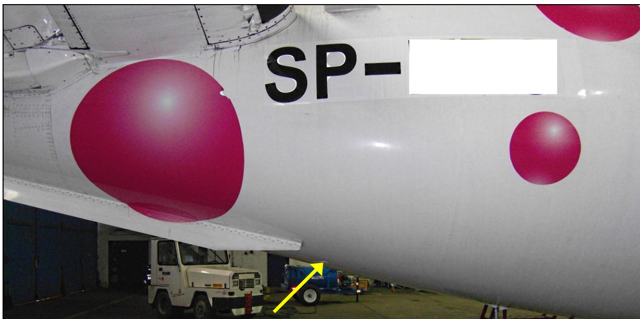
Lokalizacja miejsca uszkodzenia na kadłubie samolotu.

Po przylocie na lotnisko EPWA i zakołowaniu na stoisko 39 załoga otrzymała informację od technika o uszkodzeniu prawej dolnej powierzchni niehermetyzowanej tylnej części kadłuba samolotu, mającego charakter otworu po uderzeniu narożnikiem twardego przedmiotu, jakim mogło być nadwozie pojazdu lotniskowego lub przewożony przez ten pojazd ładunek.