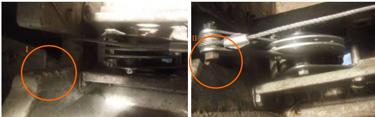
Porównanie warunków pracy zaczepów: I - w szybowcu biorącym udział w zdarzeniu; II - innym szybowcu tego samego typu